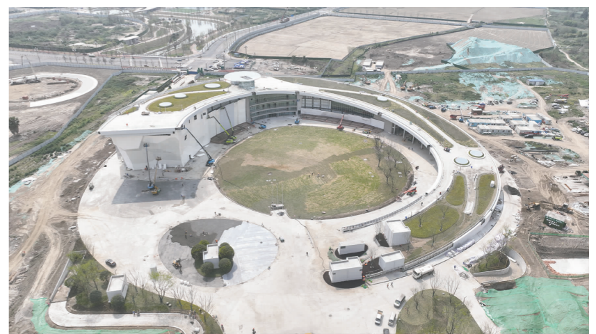
航拍中国·眉山国际攀岩中心。

本报讯(眉山日报全媒体记者雷卓鸣 文/图)4月1日,备受瞩目的中国·眉山国际攀岩中心顺利通过预验收,标志着这一世界级的攀岩胜地即将迎来正式开放。