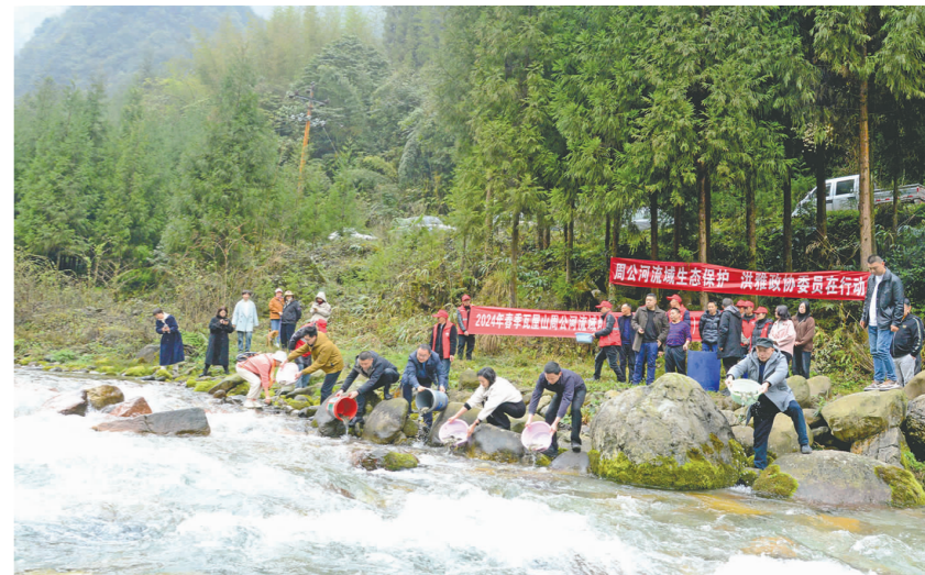
开展增殖放流，保护水域生态环境。

本报讯(魏兰 眉山日报全媒体记者 李勇军 文/图)3月17日，洪雅县政协部分政协委员、爱心人士和当地群众，在瓦屋山周公河流域开展2024年春季增殖放流公益活动。“经核验收和监督检查，这些鱼种可以放入这个天然水域。”随着洪雅县渔政执法大队执法人员的宣布，大家将20000余尾雅鱼、6000余尾胭脂鱼放流孔雀河中。