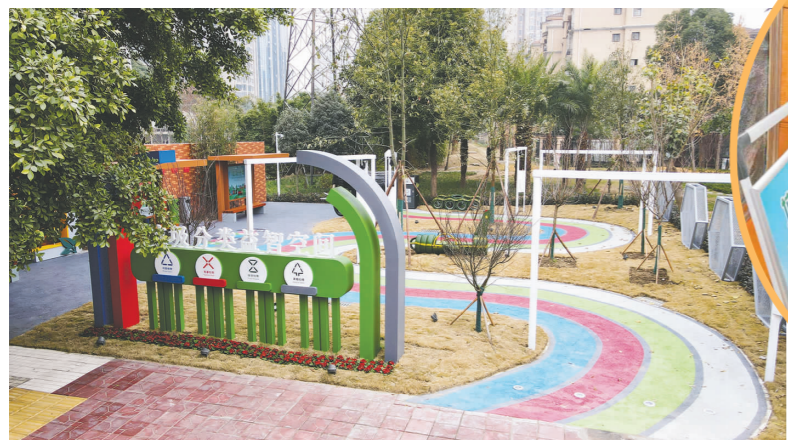
城区各公共场所随处可见生活垃圾分类设施。生活垃圾分类宣传推广到快递行业。

实施生活垃圾分类，建设绿色、人文、健康的宜居环境，需要全社会上下同心、达成共识。今年，我们将进一步优化工作布局，将生活垃圾分类工作作为基层治理体系和治理能力现代化重要内容，补强市、县(区)、街道、社区四级协调联动机制，推动生活垃圾分类走深走实。