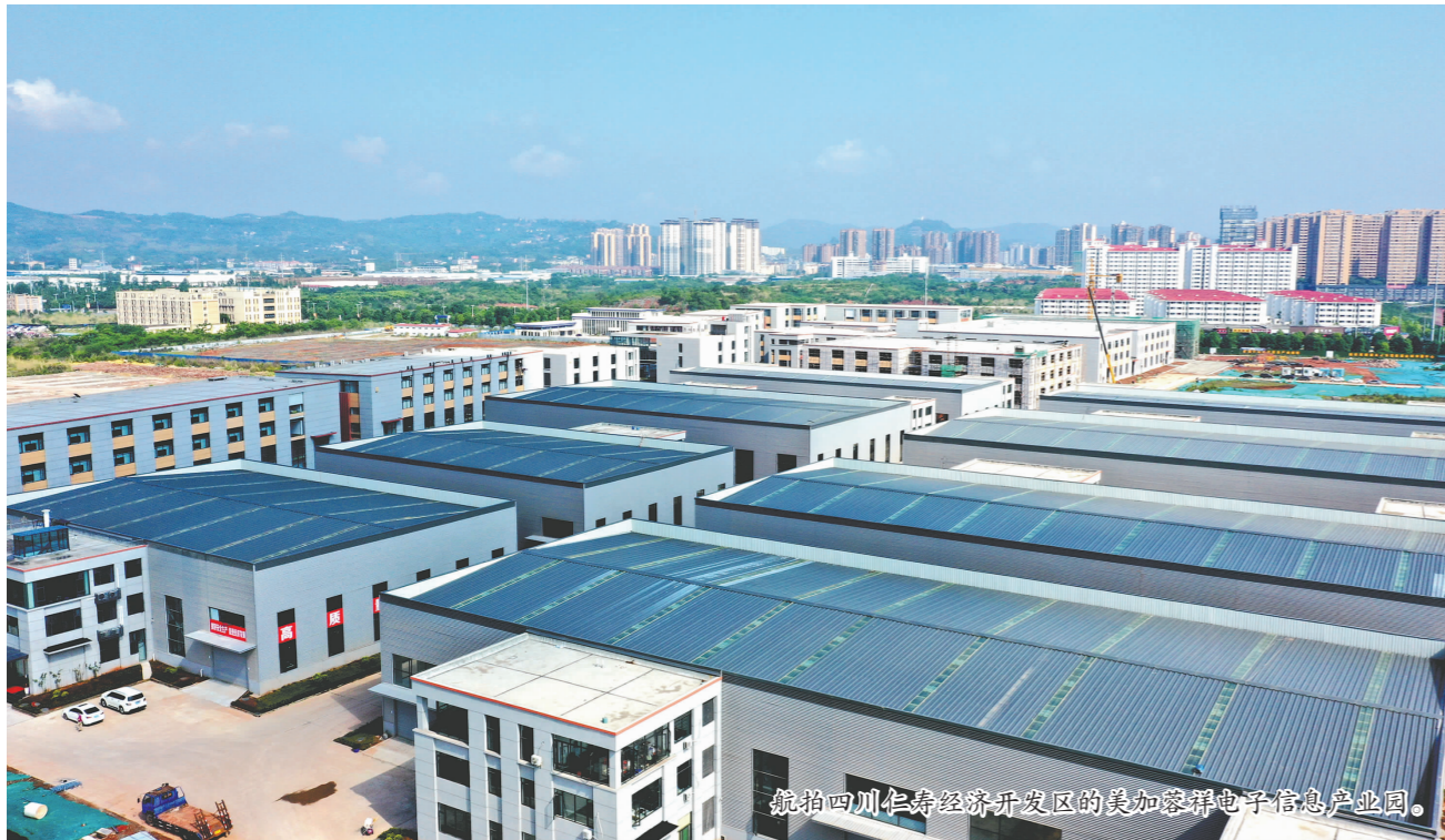
航拍四川仁寿经济开发区的美加登群电子信息产业园。