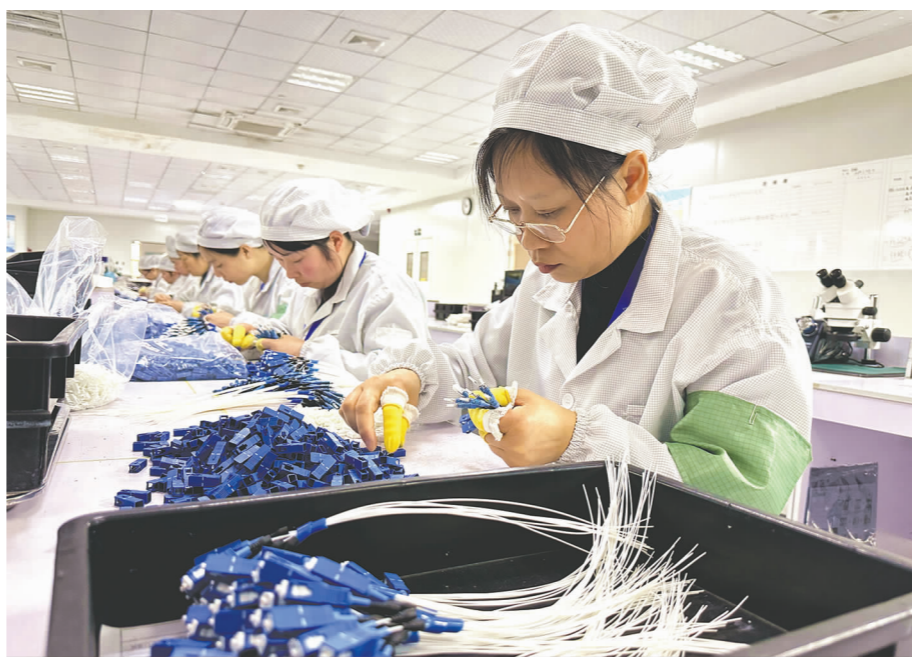
四川灿光光电有限公司生产车间里，工人正在生产线上忙碌。

“新”风扑面，“质”感满满。截至目前，四川仁寿经济开发区共有电子信息企业30余户，其中规模以上工业企业14户。随着信利项目招引落户，初步形成了以“显示器件—显示面板—终端应用”为链条的产业雏形。