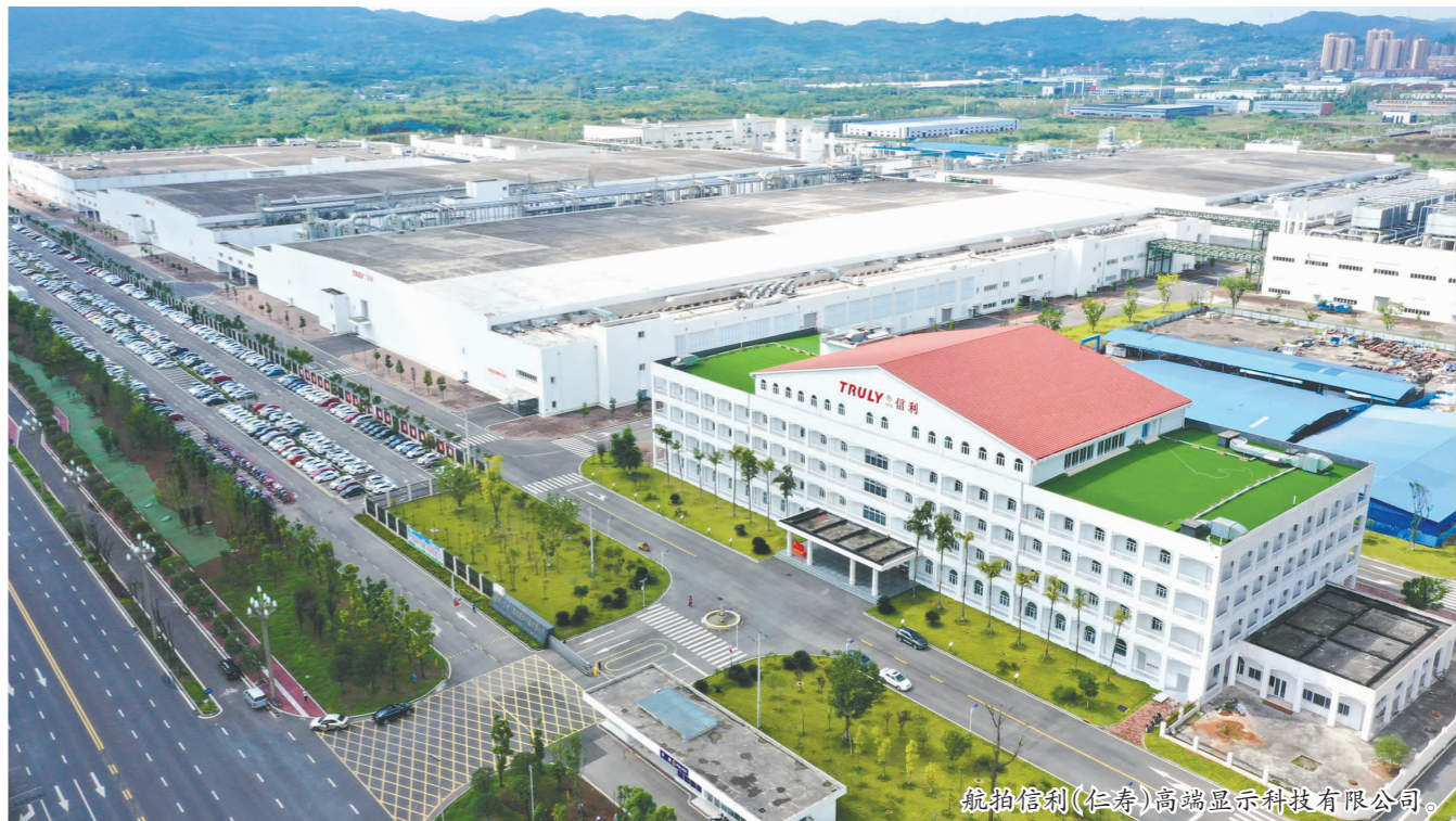
航拍信利(仁寿)高端显示科技有限公司。