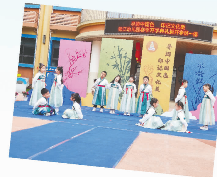
孩子们身穿传统服饰表演节目。