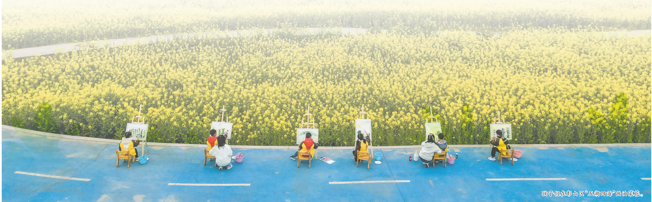
孩子们在彭山区“五湖四海”画油菜花。