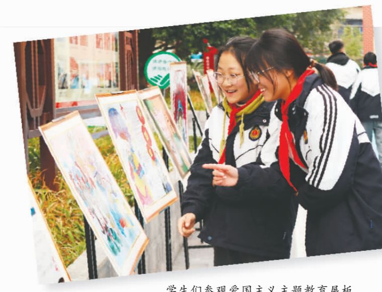
学生们参观爱国主义主题教育展板。