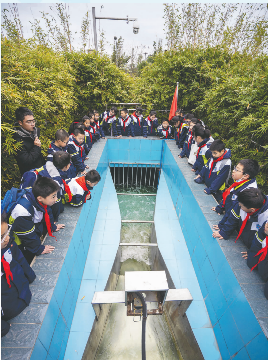
学生们参观眉山水文中心彭山水文测报中心。