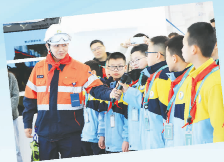
学生们参观雅保四川新材料有限公司,并与工作人员互动。

在企业展厅,工作人员深入浅出地为学生们讲解“锂”材料的制造流程,一个个有趣的科学问题解放着孩子们的大脑。学生们认真倾听,积极思考,大胆回应。安全帽该怎样戴?安全服该怎样穿?安全手套为什么又软又厚?安全鞋为什么能抵挡重力?……随后,学生们就地上了一堂生动的安全知识课,科技感超强的安全防护设备吸引了学生们的目光,大家迫不及待地穿上体验服向工作人员提问并探讨,科技创新的种子在学生心中悄悄萌芽。