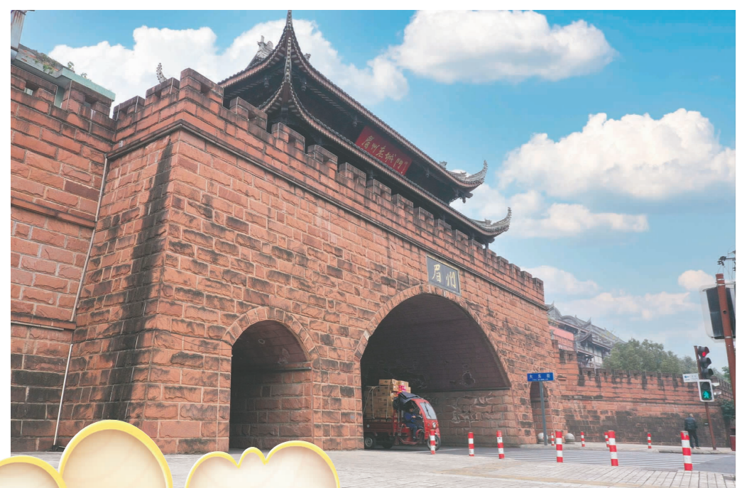
眉州古城墙历史文化街区。