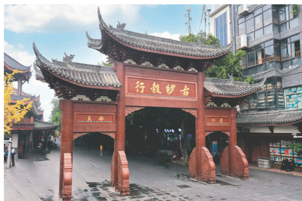
三苏祠历史文化街区。