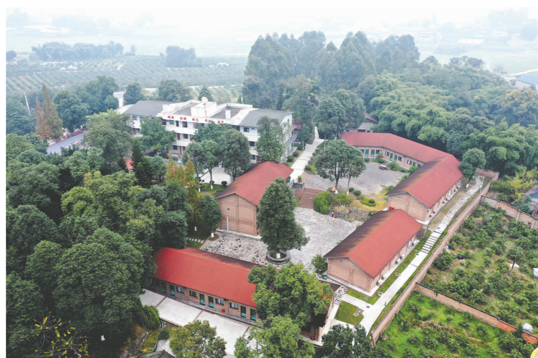
四川国际电台历史文化街区。