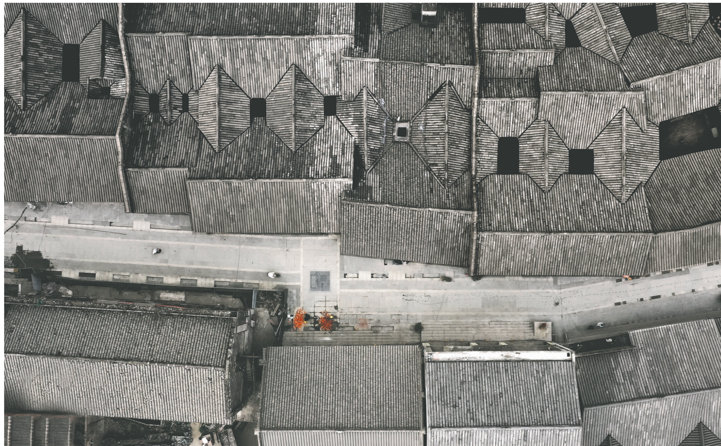
太和老镇历史文化街区。

眉山这座历史文化名城与山水相依、与时俱进，脚步中蕴藏着“阅尽千帆，归来仍是少年”的蓬勃朝气。统筹历史文化保护传承和城市高质量、可持续发展，传承弘扬三苏文化东坡文化，积极申报国家历史文化名城，是我们这代眉山人的思想共识，更是我们初心不改的时代使命。