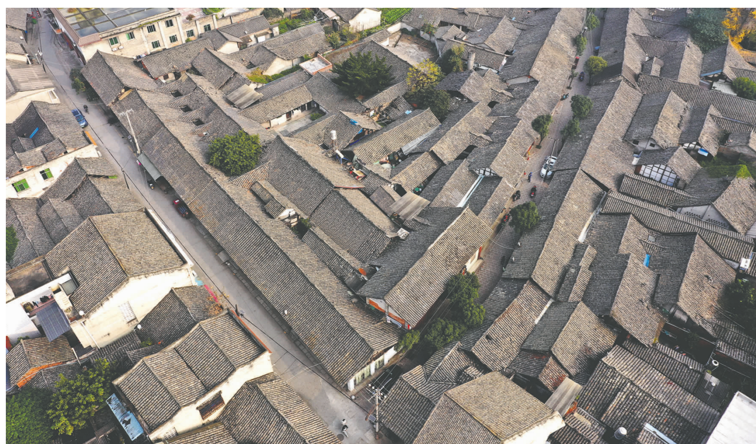
太平古街历史文化街区。