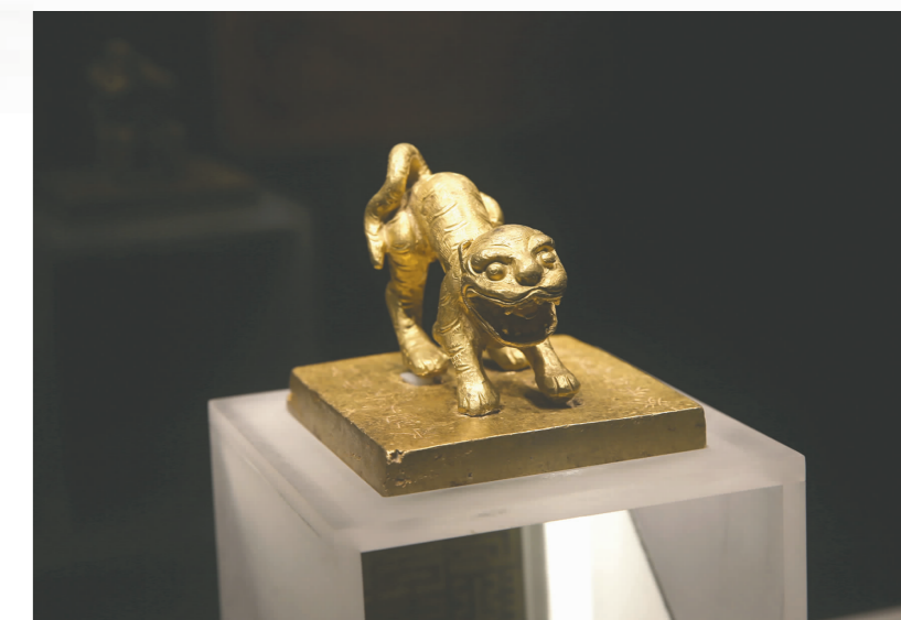
江口明末战场遗址考古成果(虎钮大元狮金印)。