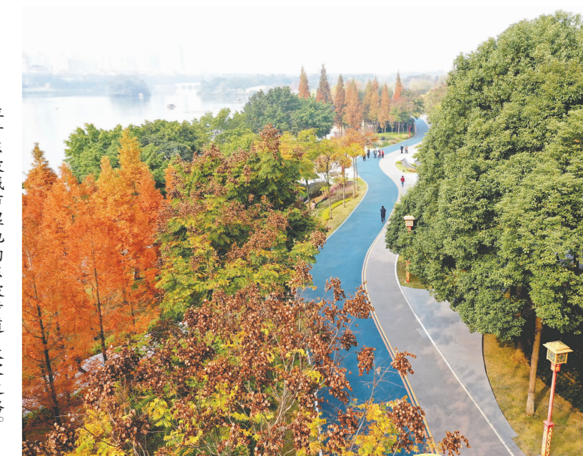
位于东坡城市湿地的东坡步道、大家之路。