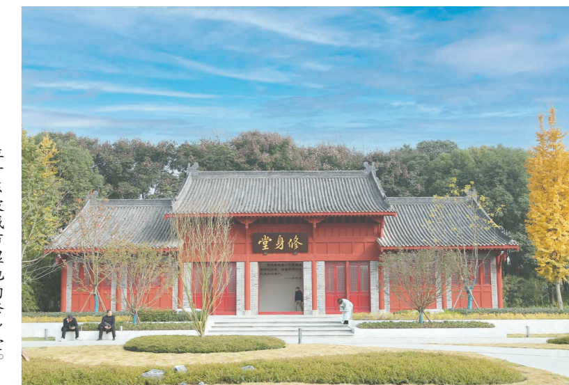
位于东坡城市湿地的修身堂。