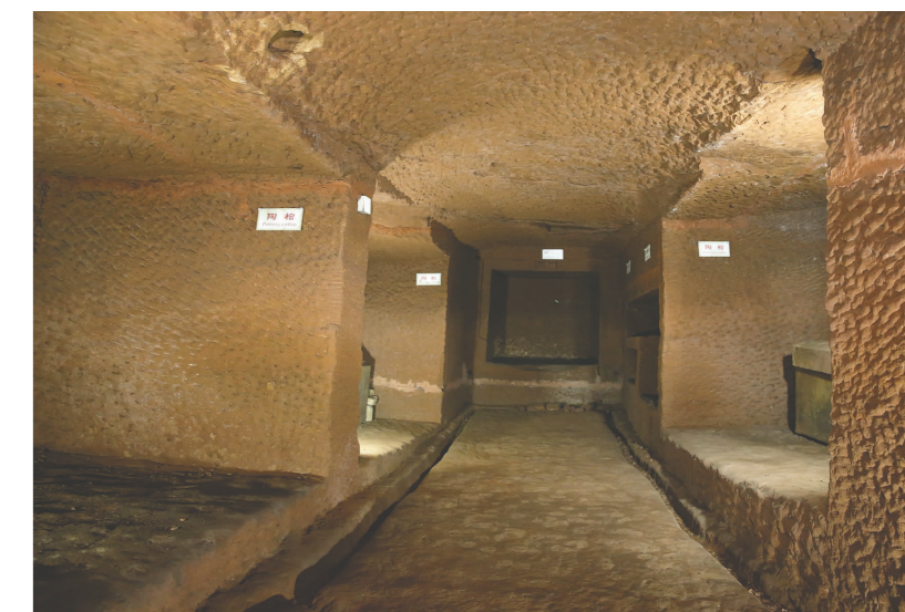
江口崖墓(彭山汉崖墓博物馆)内部。