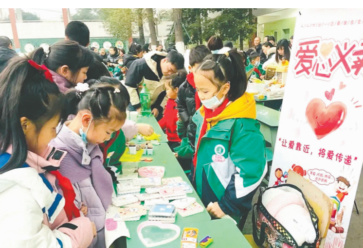
孩子们积极参与爱心义卖。

本报讯(眉山日报全媒体记者 张丹梅 文/图)“走过路过千万不要错过。”“大抛货,最低只要1元。”……近日,东坡区东坡小学组织开展了“让爱起跑 情满东坡”主题爱心义卖活动,旨在培养学生热衷公益,锻炼学生团队协作和社会交往能力,像东坡一样,做一个仁爱的人。