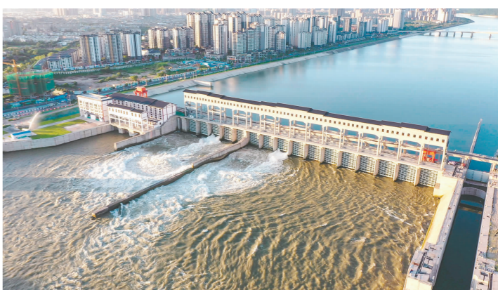
岷江尖子山航电枢纽工程推进顺利。