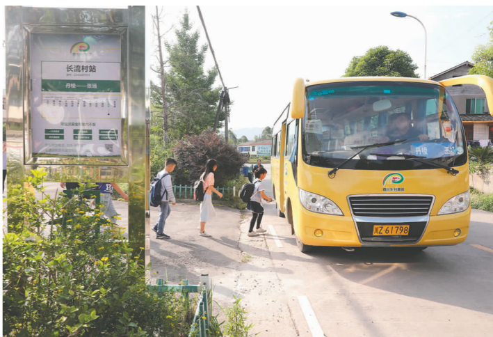
城乡公交,让农村群众出行更加方便快捷。

倍、全国的4.7倍,成眉200多公里市界线平均间隔约20公里就有1条干线公路,约40公里就有1条高速公路。全市公路运输总周转量达71.36亿吨公里,高于全省平均增速3.38%,持续位居全省第一方阵。组织开行“春风行动”专车43趟次,安全有序运送832名农民工返乡返岗、学生返家返校;高考、中考期间,“黄丝带”爱心免费送考773人次。四个区县实现城乡公交一体化,新建45个乡镇邮快物流中心和217个村级“金通邮快驿站”建成运营,全市县乡村三级物流配送网络实现全覆盖,“交邮通”物流节点发送快件1537.4万件,同比增长20%。 摊开眉山交通运输图,一张气势恢宏、五彩纷呈的交通大网,在东坡大地加速编织。全市基本实现构建“对内畅通循环,对外快速连通,所有乡镇节点全覆盖”的干线公路网规划目标,公路交通格局不断优化、完善。