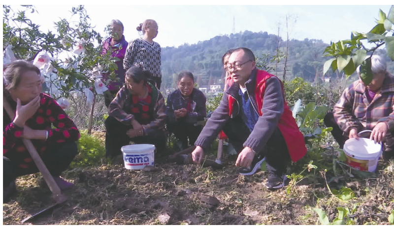
农技专家向农民传授套种知识。