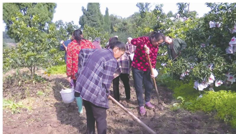
▲农民在果园地套种胡豆。