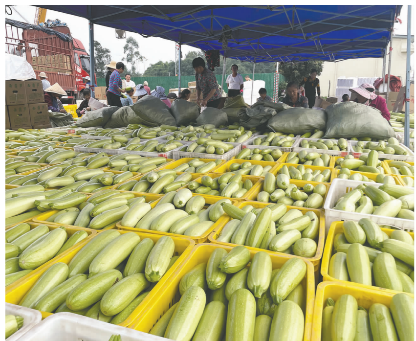
西葫芦迎来丰收季。