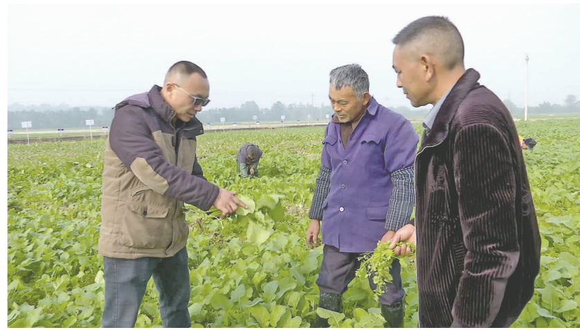
农技专家在油菜种植基地指导农户管护油菜越冬。