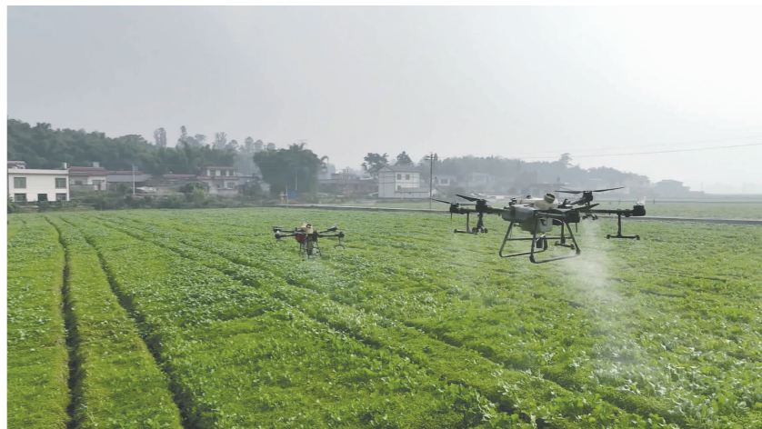
利用无人机进行油菜施肥管护。

近年来,彩花油菜成为不少地方农旅融合发展的新增长点。今年青神县在大力推广高产高油的品种之外,也在该县粮油现代农业园区市级示范片核心区的竹里稻香示范区种植了五彩油菜品种。在保证产量的同时,提高了观赏性。油菜花在开花季节,不仅有传统的黄色,还有玫瑰红等花色,颜色鲜艳,花色纯正,花瓣更大,观赏性更强。下一步,该县还将从菜、花、蜜、油、饲料和肥等几个方面来拓展油菜的价值链,不断提质增效,绘好农旅融合发展蓝图。