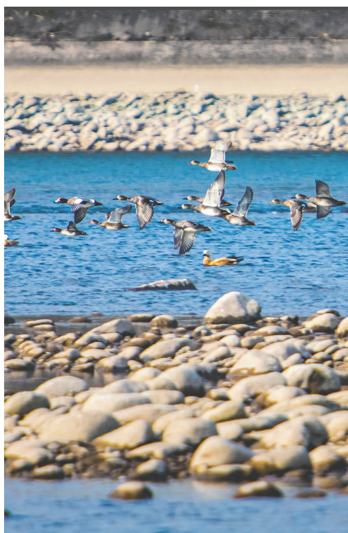
展翅飞翔。 张锐红 摄于洪雅县安宁大桥