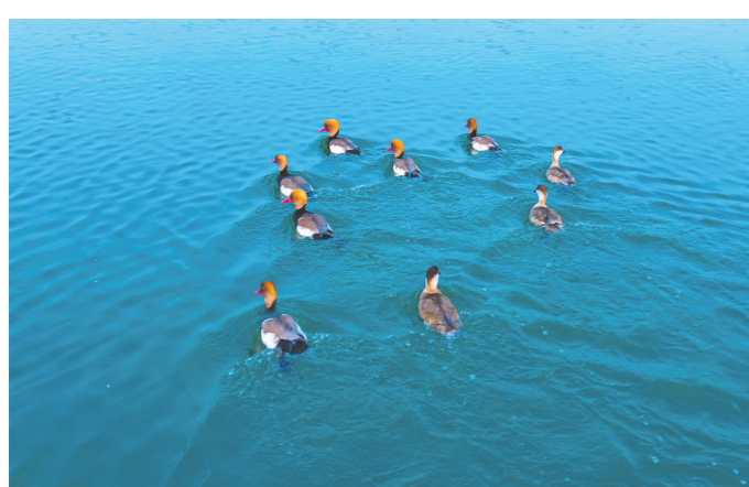
组队觅食。