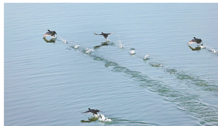
白骨顶鸡“水上漂”。 摄于彭山区岷江河畔

据了解,这样的景观已是近些年的常态。近年来,眉山大力抓好生态文明建设,水环境不断得到保护与修复,良好的生态环境吸引越来越多鸟类前来“作客”,甚至长居眉山,成为一道人与自然和谐共融的亮丽风景线。让我们通过镜头去欣赏并认识一下这些可爱的“精灵”吧。