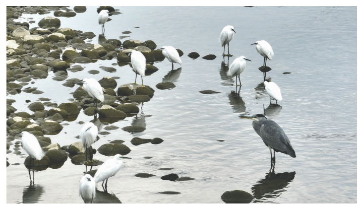
河畔小憩。 摄于东坡区岷江段