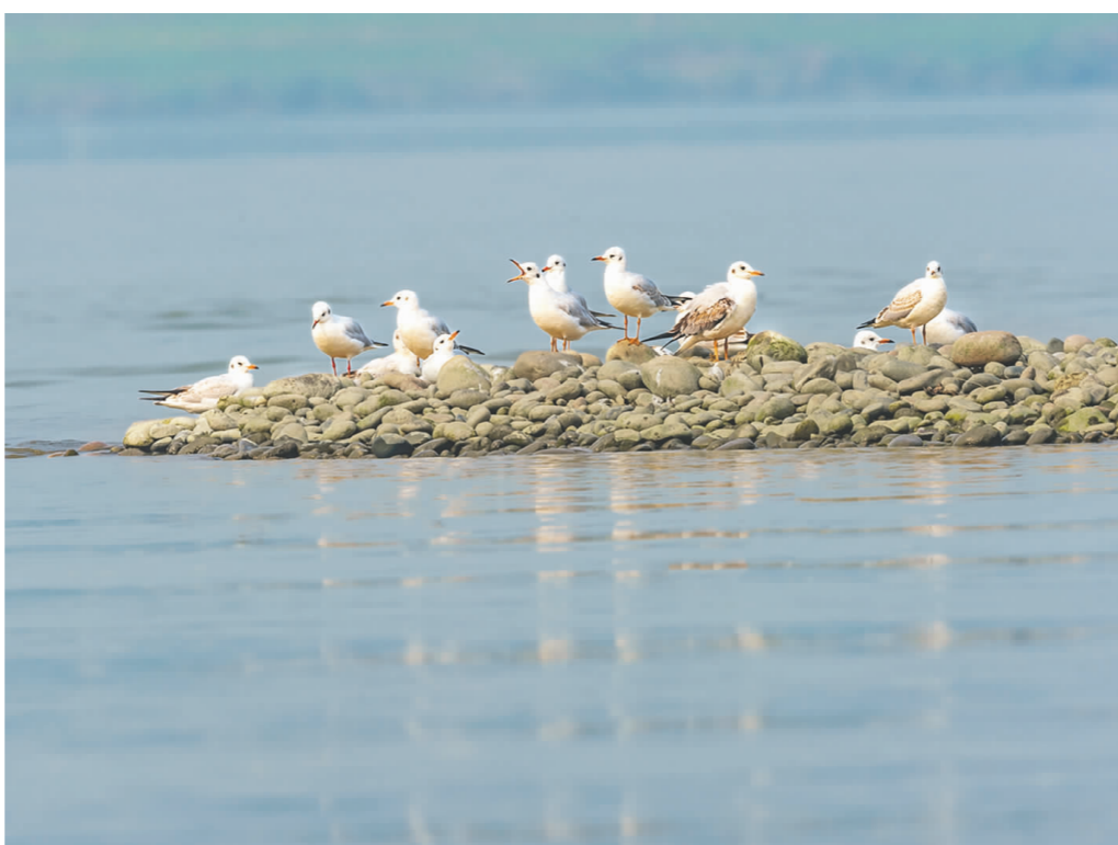
滩头红嘴鸭。 谭永忠 摄于青神县中岩寺岷江边