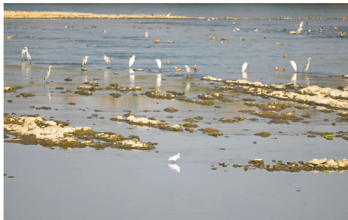
和谐共生。 摄于岷江河畔