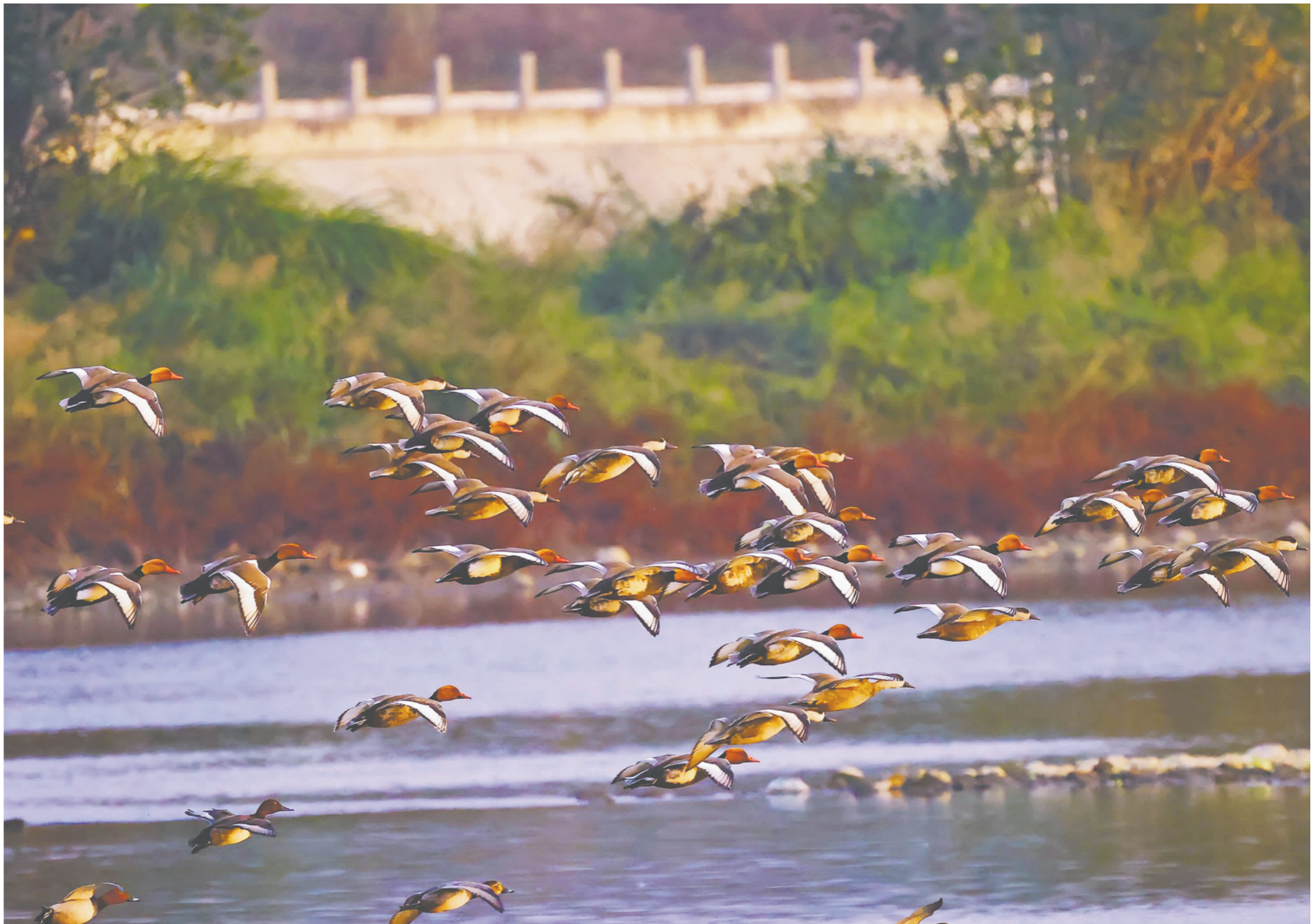
飞翔的赤嘴潜鸭群。