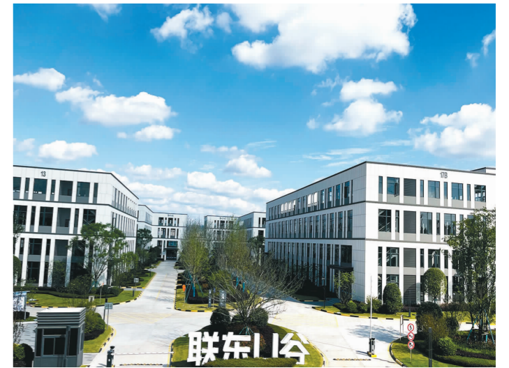
联东U谷·成眉数字经济产业园一期已投用。