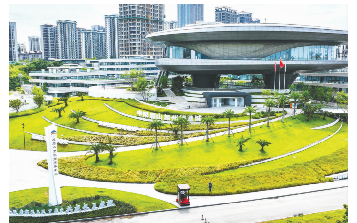
天府新区(成眉)人才协同服务中心。