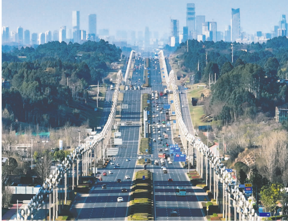
天府大道连通成眉。