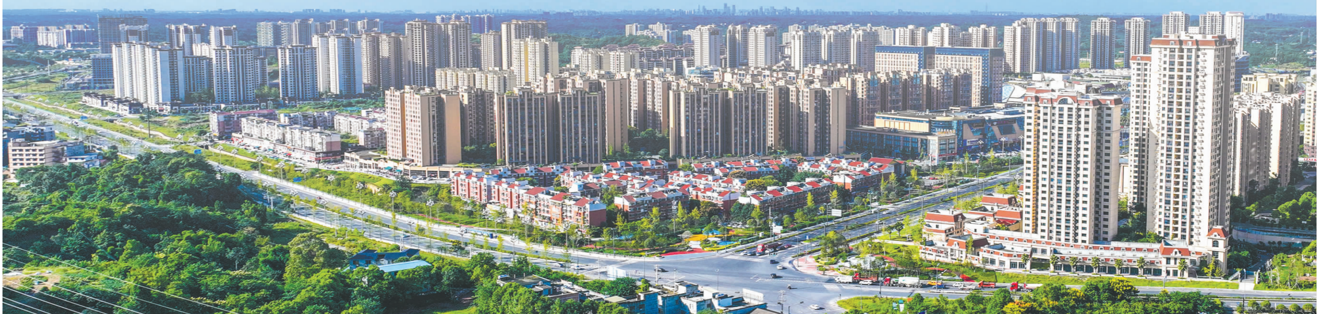
眉山天府新区坚持“服务成都、依靠成都、融入成都”。