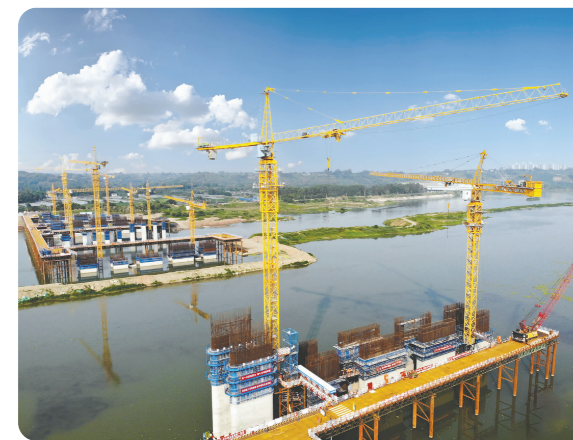
我市坚持“经济发展、交通先行”战略，着力建设成都都市圈南部综合交通枢纽。图为正在加紧建设的成眉铁路S5线岷江特大桥。