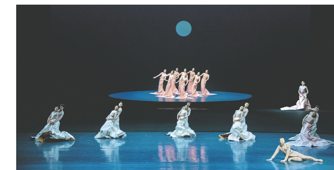
我市大力传承弘扬三苏文化东坡文化，以东坡文化月、东坡文化“六进”活动为统领，开展一系列文化惠民活动，推出一系列东坡题材主题文艺精品，赋予东坡文化新的时代内涵和现代表达形式。图为我市携手中国东方演艺集团打造的现代舞诗剧《诗忆东坡》剧照。