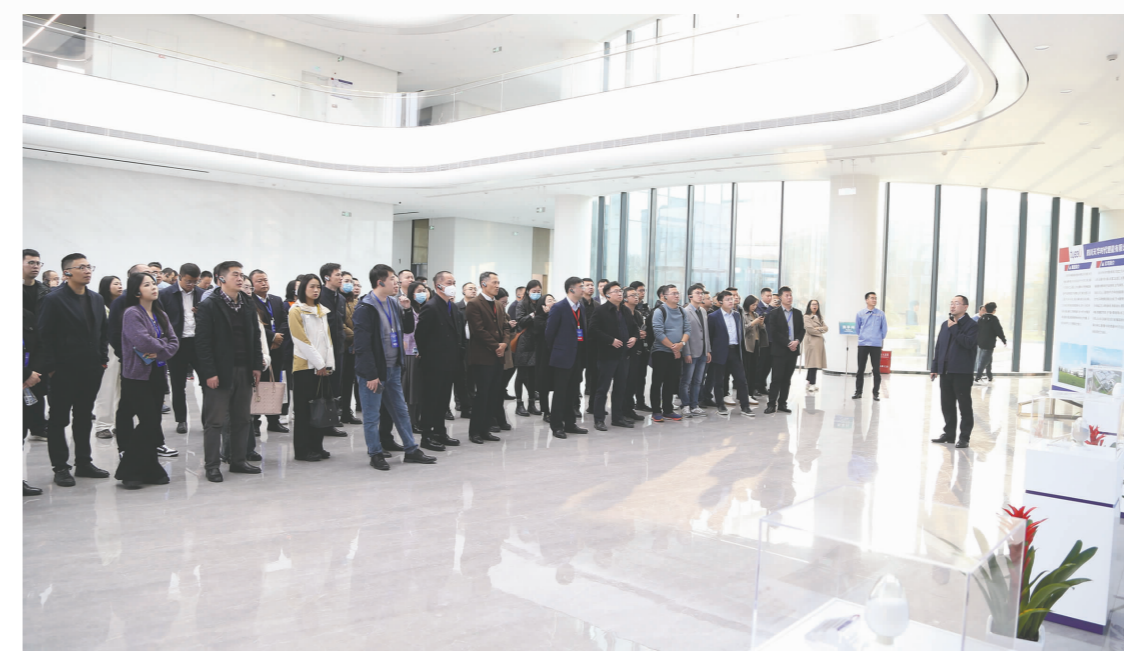
11月27日至28日，以“共筑锂电新生态，共谋绿色新未来”为主题的四川省锂电产业链供应链合作推进大会在我市举行。我市已建立起了覆盖基础锂盐、正极材料、电解液、动力电池等关键环节的锂电产业链，形成“4+N”的锂电产业空间布局体系。图为与会嘉宾参观四川天华时代锂电有限公司。