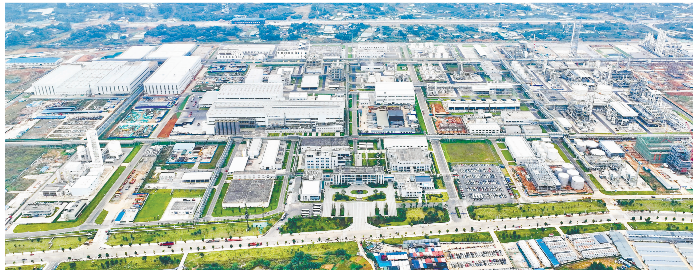
我市着力推动园区提档升级，一座座环境优美、设施现代的产业园区拔地而起。图为眉山高新区绿色化工产业基地。