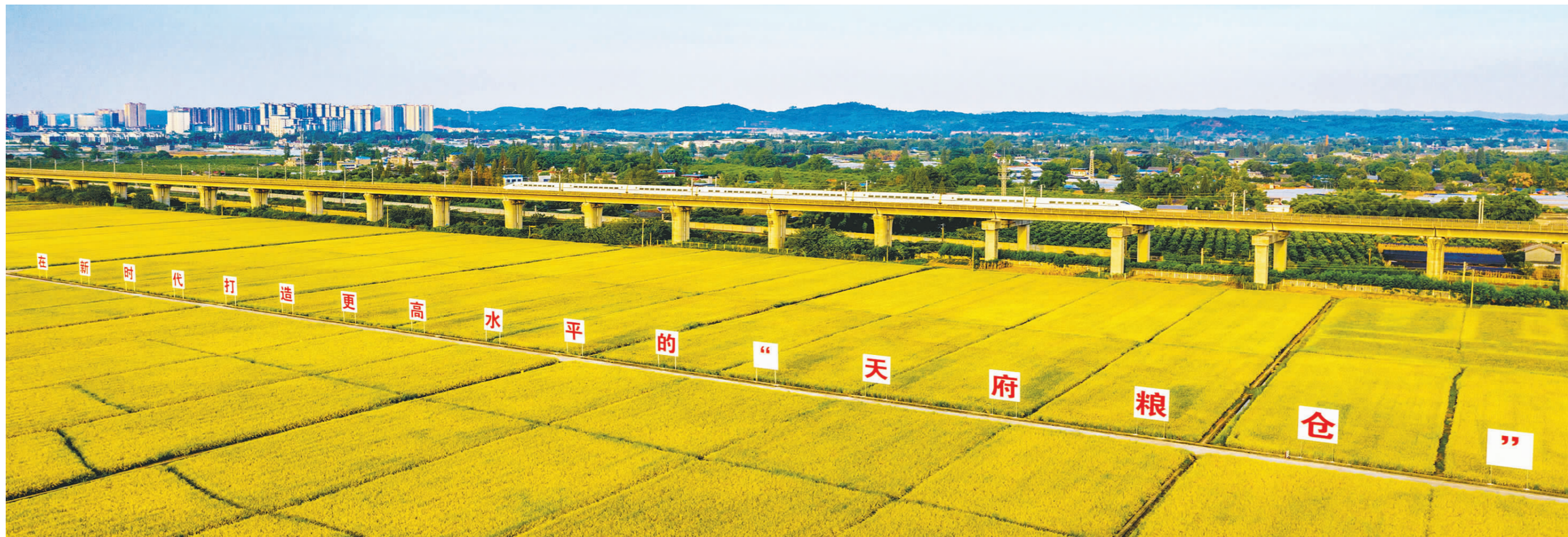
我市围绕“一核三带十片”，即永丰核心样板区、三大灌区粮食主产带和10个万亩以上粮油园区，打造“美田弥望、稻谷飘香、物阜民丰、幸福和美”的新时代更高水平“天府粮仓”示范区。图为东坡区太和镇永丰村高标准农田水稻喜获丰收。