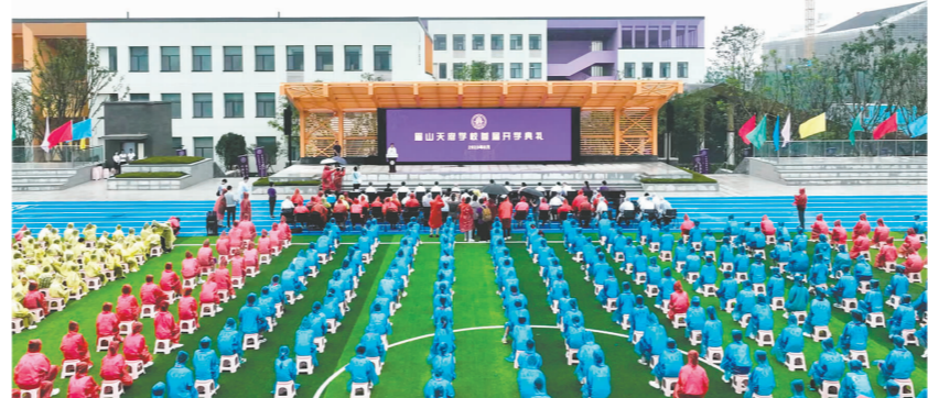
我市坚持把教育事业摆在优先位置，围绕办好人民满意的教育，大力实施教育质量提升行动，着力扩大优质教育资源供给。图为由清华大学附属中学与天府新区眉山管委会合作共办的眉山天府学校迎来首批学生。

今年以来，我市认真贯彻落实党的二十大精神和习近平总书记来川视察重要指示精神，全面落实中央、省委部署要求，按照现代化四川建设的“总牵引”“总抓手”“总思路”，围绕制造强市、开放兴市、品质立市，奋力建设成都都市圈高质量发展新兴城市。全市新能源新材料产业规模突破千亿，整体推进高标准农田建设奋力打造新时代更高水平“天府粮仓”示范区，四通八达的交通路网和眉山国际铁路港等开放平台拓展对外开放的广度和深度……一个个优质项目、一项项发展成效，彰显着“三市一城”建设的最新进展。 眉山日报全媒体首席记者 李幸