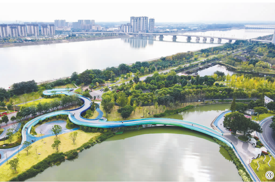
我市立足改善人居环境、完善城市功能，提升城市品质，扎实推进城市更新各项工作，加快建设高品质生活宜居城市。图①市委党校新校区；图②太和老镇历史文化街区提升改造项目建设现场；图③东坡步道·大家之路经济美桥；图④升级改造后的眉山城区环中巷。