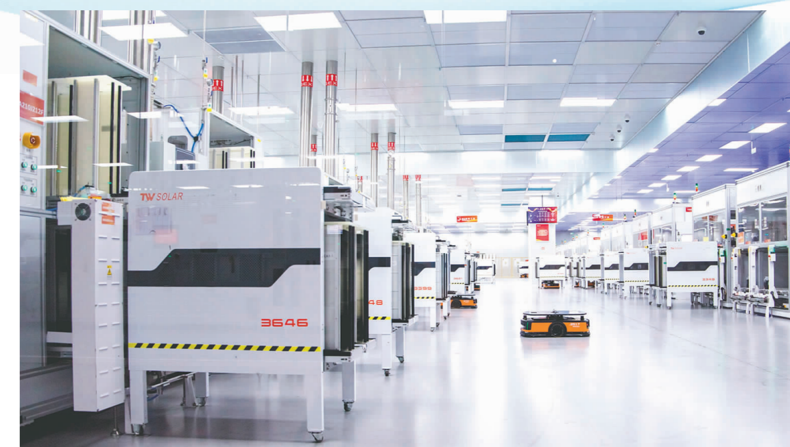
我市大力发展晶硅光伏产业，现已集聚通威太阳能、晟升光伏等晶硅光伏产业龙头企业，总投资超400亿元，全部达产后将形成产值1000亿元以上。图为通威太阳能(眉山)有限公司智能化生产车间。