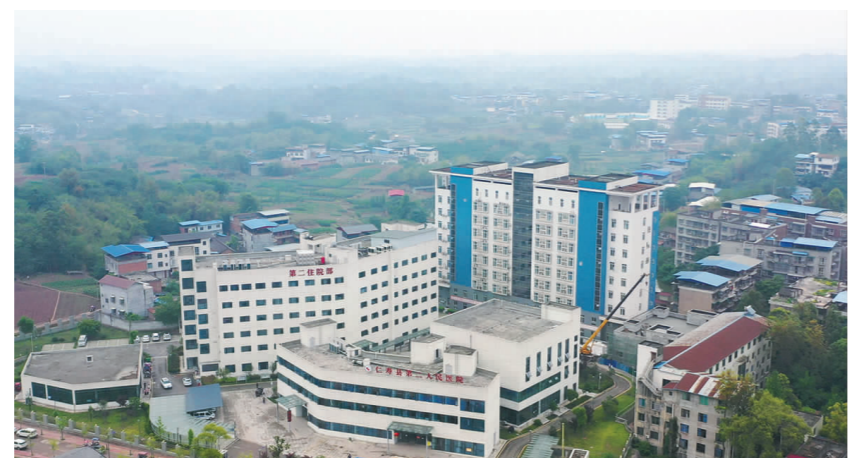
我市加速集聚优质医疗资源，着力打造成都市南部医学中心，同时健全夯实乡村医疗卫生服务网络，加快打造现代乡村医疗卫生体系建设先行市。上图为全省首个国家区域医疗中心——四川大学华西第二医院天府医院·四川省儿童医院，下图为仁寿县第二人民医院(富加镇卫生院)。

今年以来，我市认真贯彻落实党的二十大精神和习近平总书记来川视察重要指示精神，全面落实中央、省委部署要求，按照现代化四川建设的“总牵引”“总抓手”“总思路”，围绕制造强市、开放兴市、品质立市，奋力建设成都都市圈高质量发展新兴城市。全市新能源新材料产业规模突破千亿，整体推进高标准农田建设奋力打造新时代更高水平“天府粮仓”示范区，四通八达的交通路网和眉山国际铁路港等开放平台拓展对外开放的广度和深度……一个个优质项目、一项项发展成效，彰显着“三市一城”建设的最新进展。 眉山日报全媒体首席记者 李幸