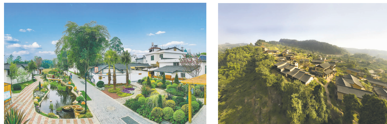
我市在阵地建设、村容村貌整治、产业发展、乡风文明建设等方面多点发力，不断激发农村发展活力，全力促进乡村振兴。图为青神县青竹街道兰沟村竹里巷子(左)和丹棱县顺龙乡幸福古村幸福岭(右)。