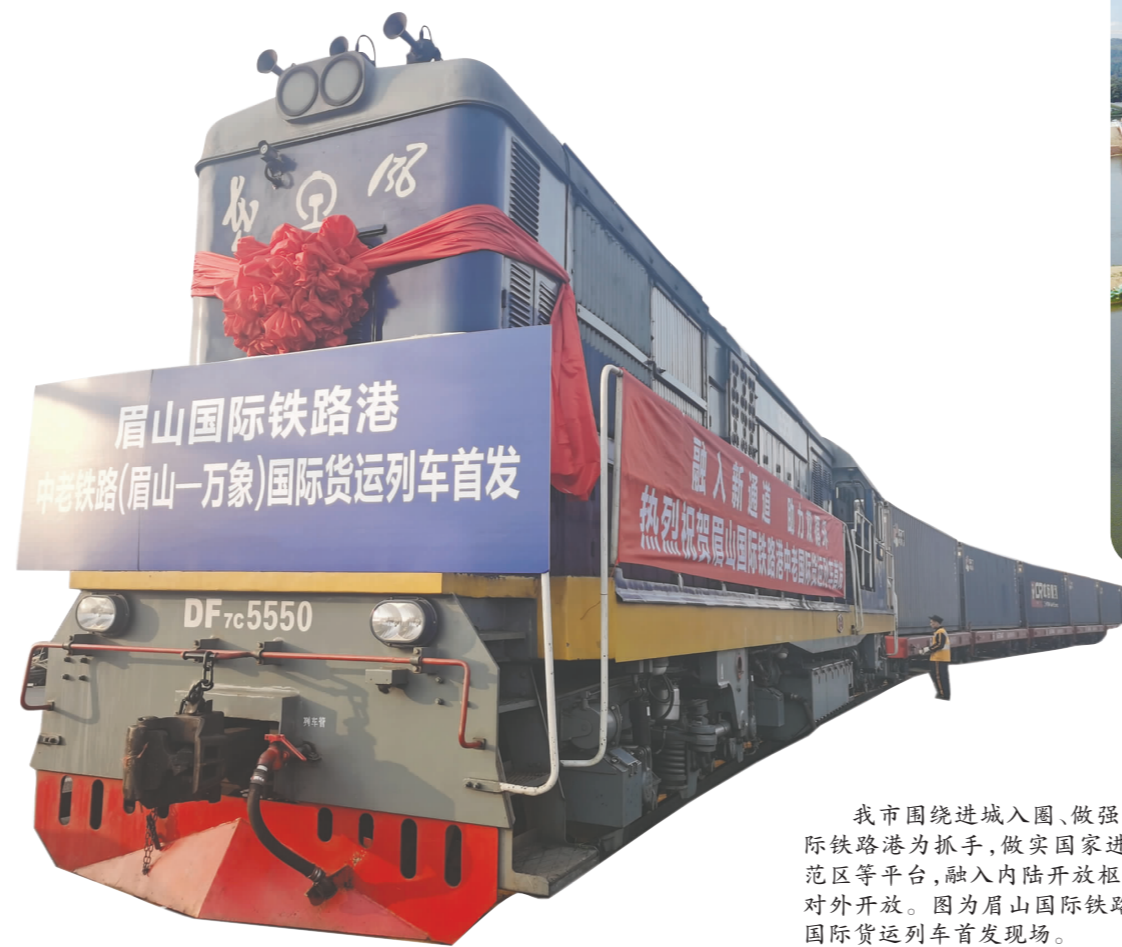
我市围绕融入圈、做强主干，以建设眉山国际铁路港为抓手，做实国家进口贸易促进创新示范区等平台，融入内陆开放枢纽，推进更高层次的对外开放。图为眉山国际铁路港开行的中老铁路国际货运列车首发现场。