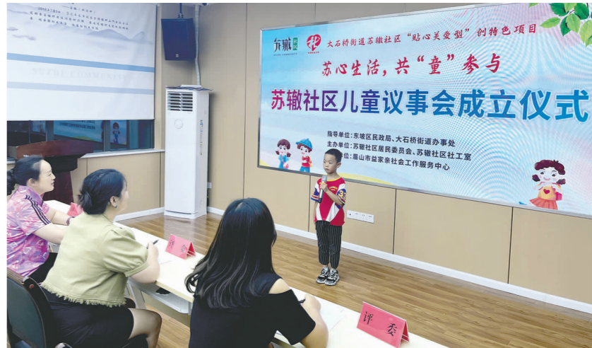
儿童代表积极参加议事会竞选。

本报讯(眉山日报全媒体记者 王允浩 文/图)为了培育壮大群众自治队伍,推动建立多元主体参与的社区治理新格局,近日,在东坡区民政局、大石桥街道办事处指导下,由苏辙社区居民委员会、苏辙社区社工室和眉山市益家亲社会工作服务中心联合打造的儿童议事会正式成立。