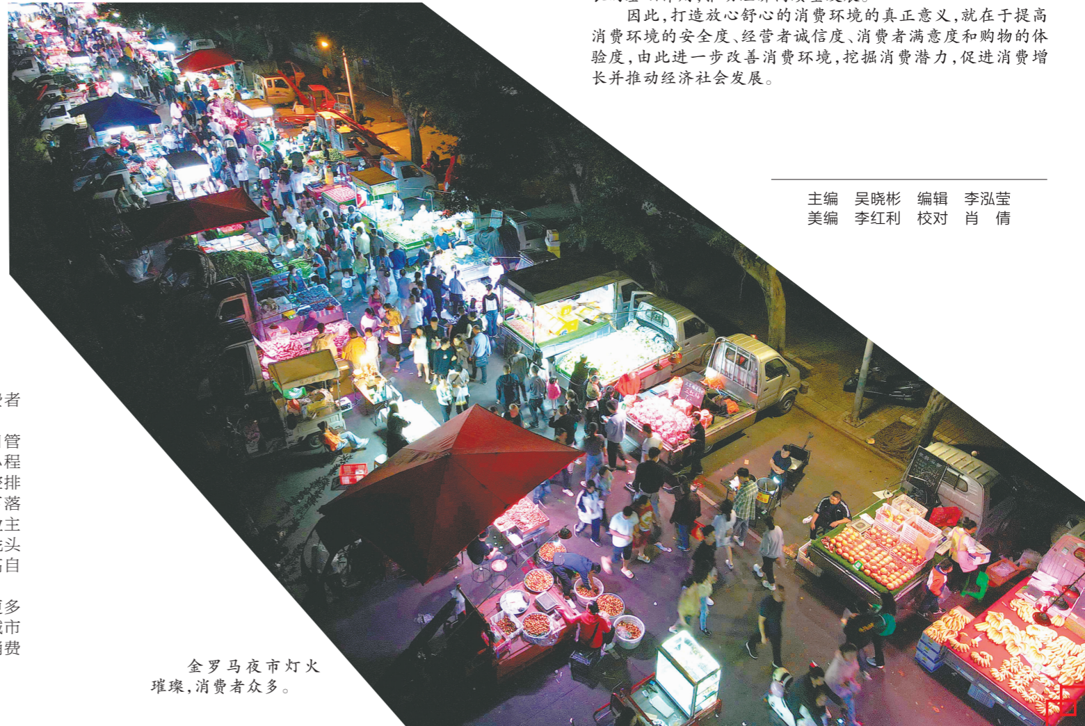
金罗马夜市灯火璀璨，消费者众多。