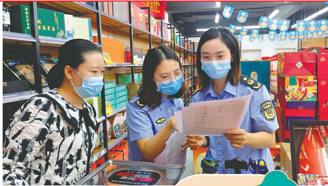
开展食品安全检查。