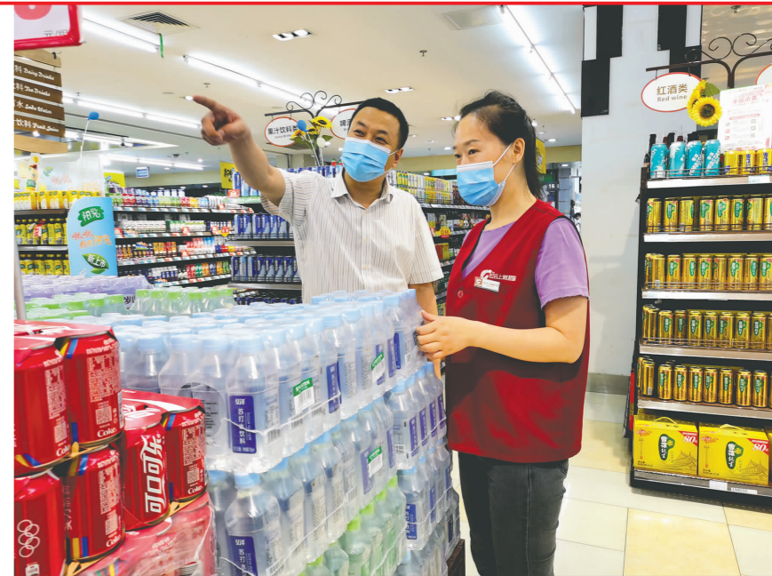
商超开展节前检查。