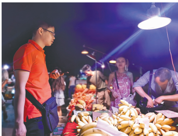
消费者在金罗马夜市购买水果。