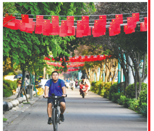
眉山城区,成组的国旗装饰将街道装扮一新,国庆氛围渐浓。