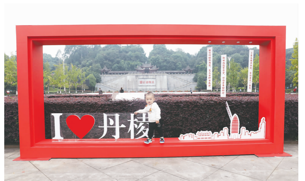
丹棱城区,喜庆的摆台营造了浓浓的节日氛围。