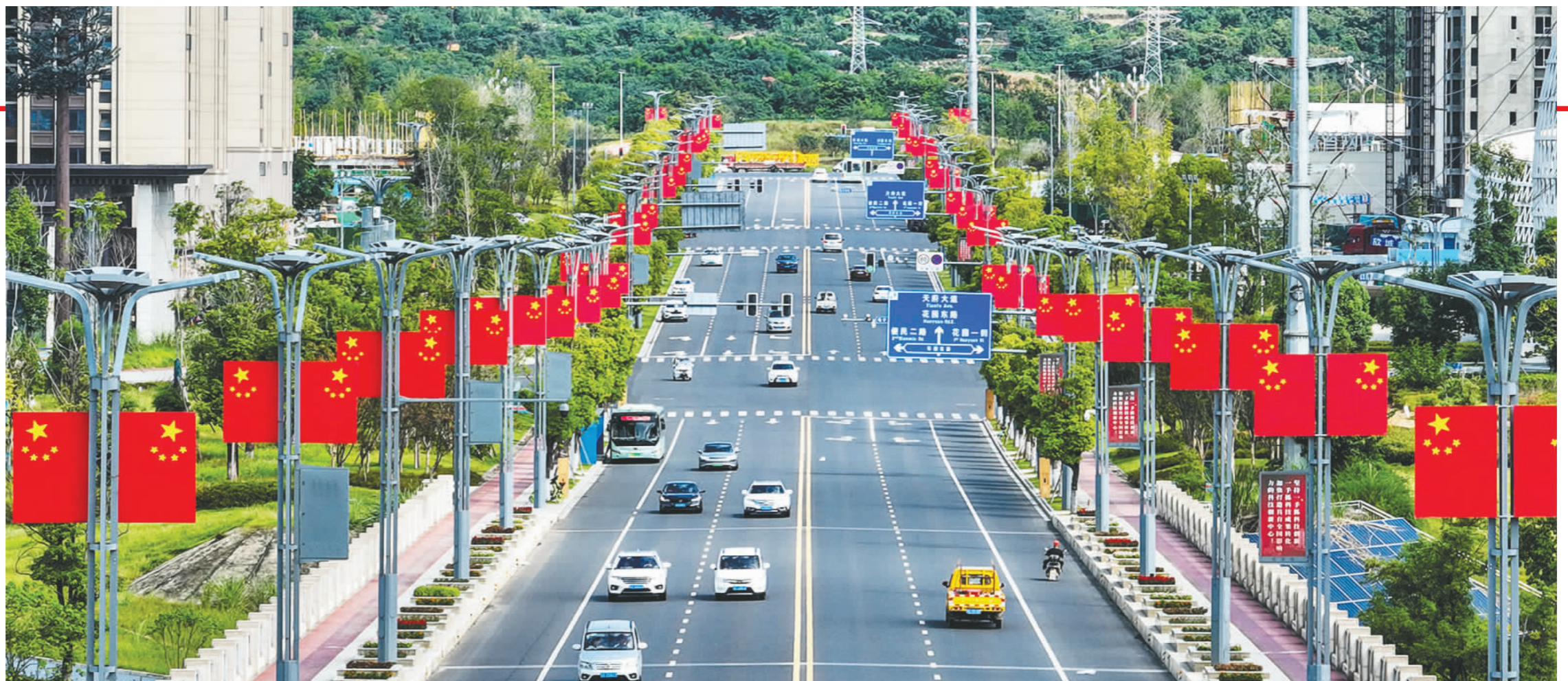
眉山天府新区天府大道新挂的国旗格外鲜亮,喜迎国庆节到来。

国庆将至,近日,在眉山城区及各区县,一面面国旗高高飘扬,一朵朵鲜花竞相绽放,在蓝天白云的映衬下形成了一道靓丽的风景线,满城洋溢“中国红”。