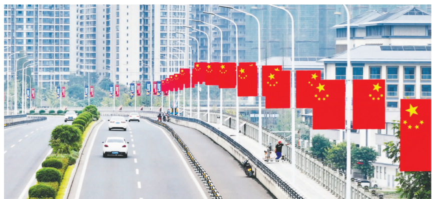
青神县岷江二桥桥头国旗鲜艳,节日氛围日渐浓郁。