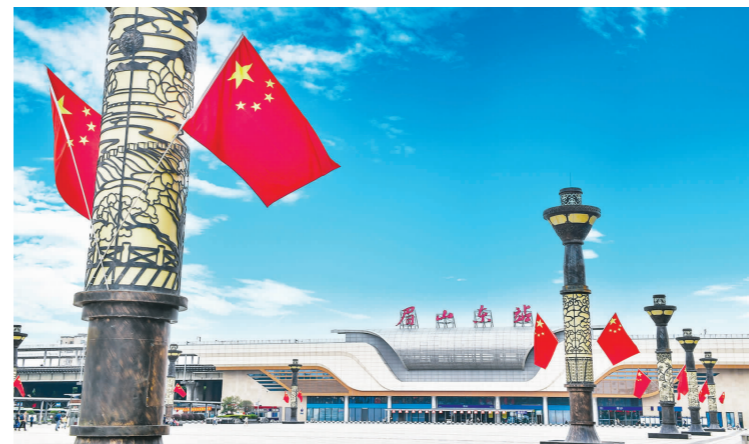
眉山东站红旗招展,欢迎各方宾朋。