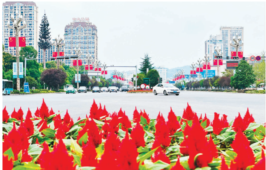
仁寿城区,一抹抹显眼的“中国红”形成一道靓丽的“红色风景线”。