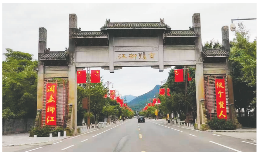
洪雅县柳江镇主干道,悬挂的国旗烘托节日氛围。