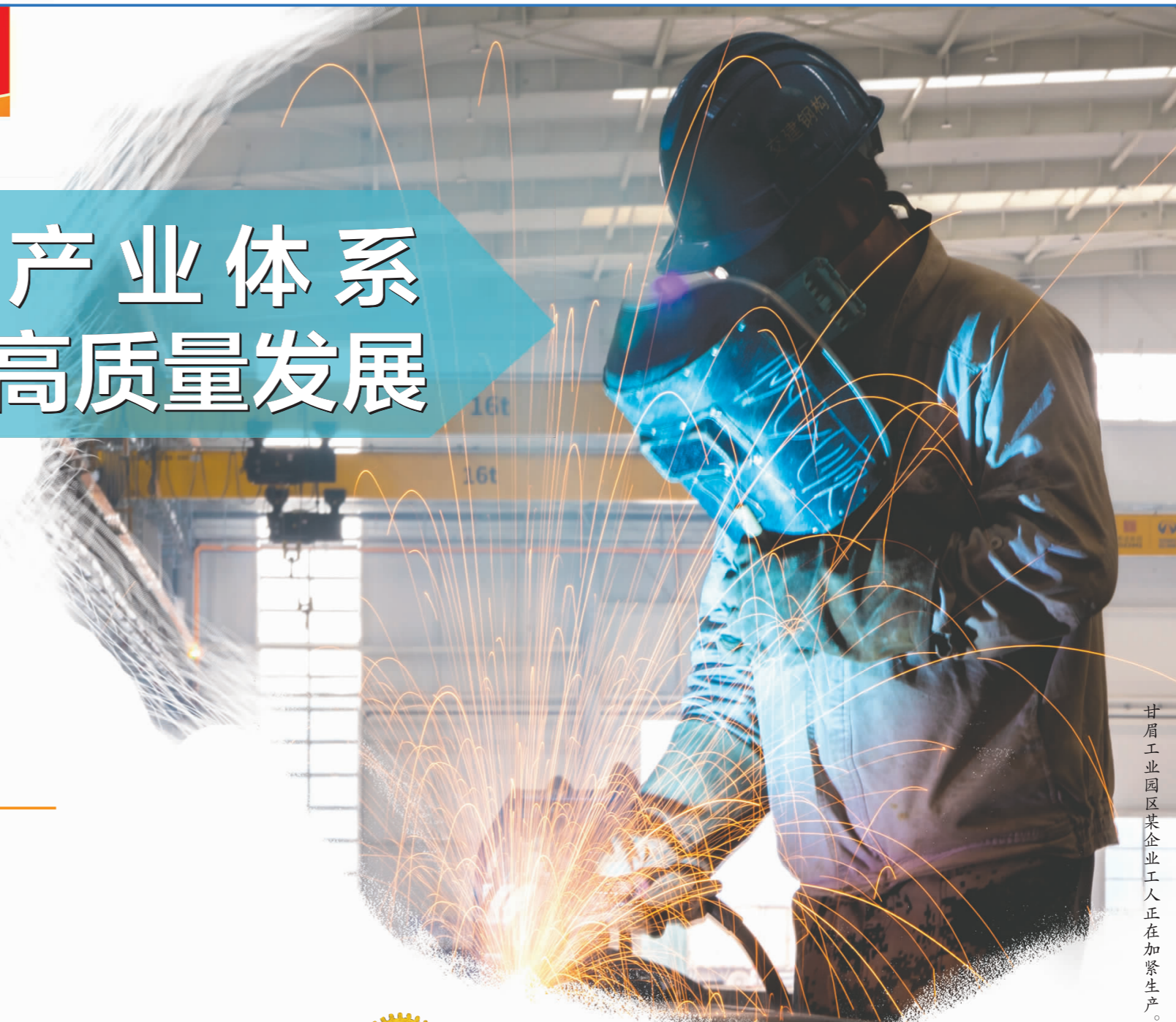
甘眉工业园区某企业工人正在加紧生产。