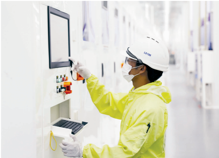
工人操作高端精密设备。