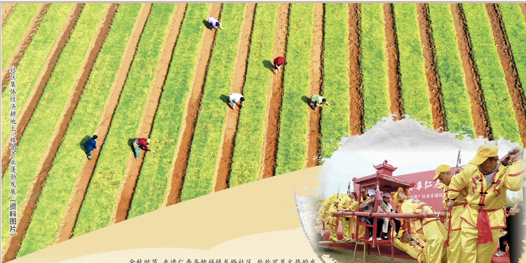
往区集体经济耕地上，粮食产业蓬勃发展。(资料图片)

金秋时节，走进仁寿县钟祥镇龙桥社区，处处可见火热的水稻收获场景，轰鸣的机器与往来的群众让乡村充满了勃勃生机，勾勒出产业兴旺、生活幸福、家园和谐的美好蓝图。