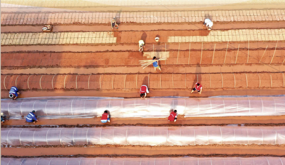
每到农忙，社区党员志愿者便深入田间地头帮助缺劳户。(资料图片)

同时，充分发挥“五老”优势，通过整合资源、组建队伍、按需服务、双向互动等形式，积极开展传递社会正能量、弘扬社会主旋律系列活动，真正让“五老”人员老有所依、老有所养、老有所乐、老有所为，实现“小事不出网格、难事不上交”，为社区和谐稳定保驾护航，共建和谐家园。