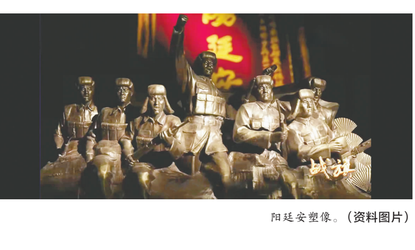
阳延安塑像。