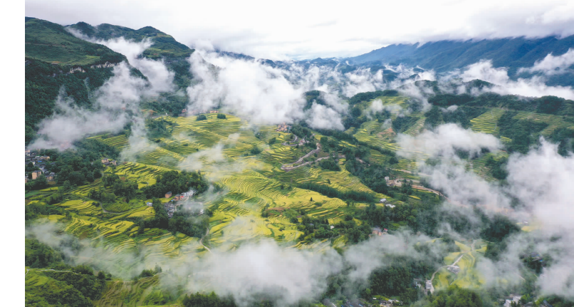
酉阳土家族苗族自治县花田乡梯田。