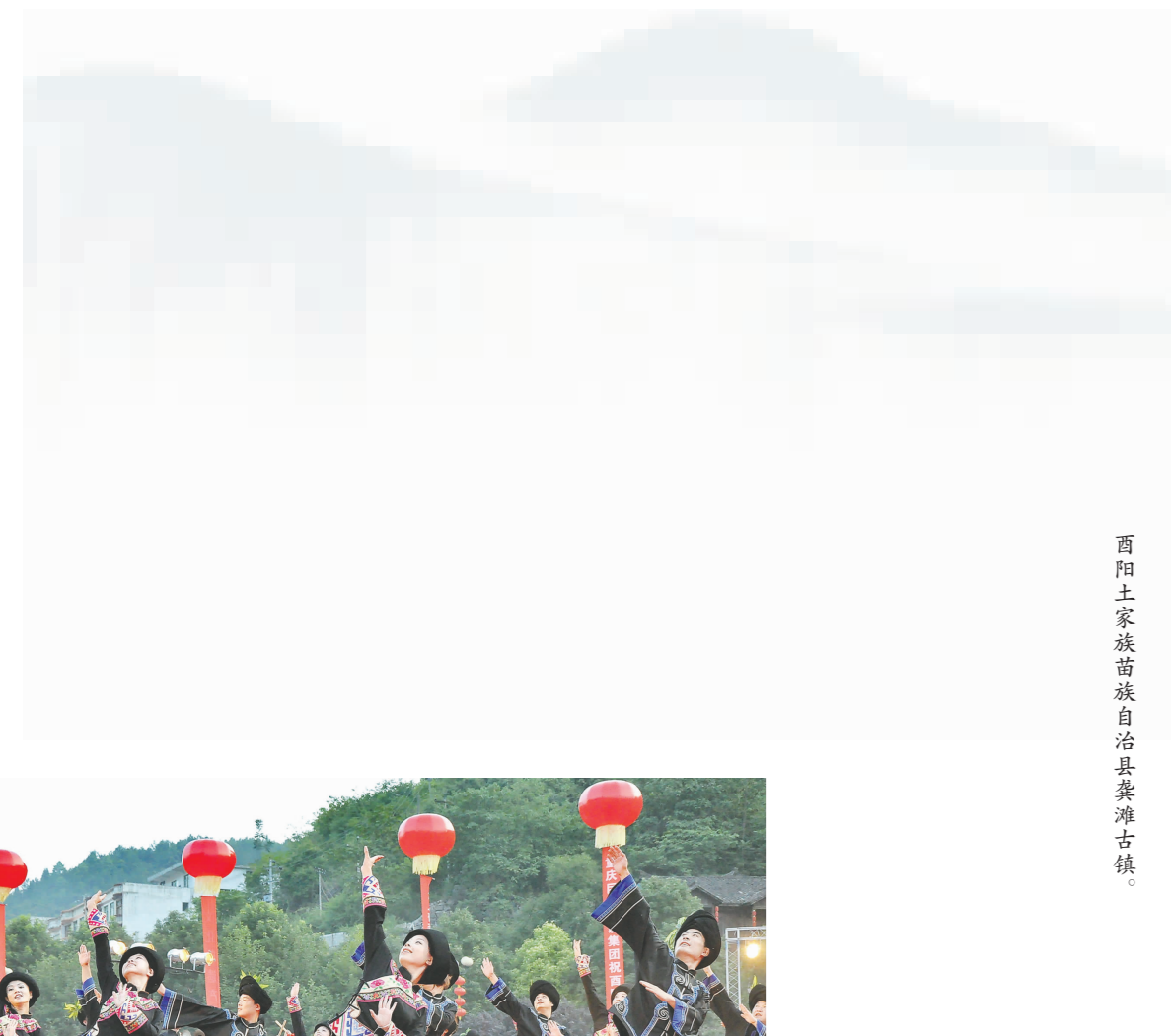
酉阳土家族苗族自治县龚滩古镇。