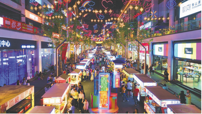
仁寿县栖西里商业街区。