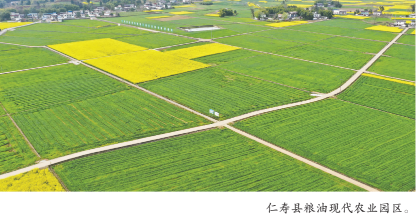
仁寿县粮油现代农业园区。