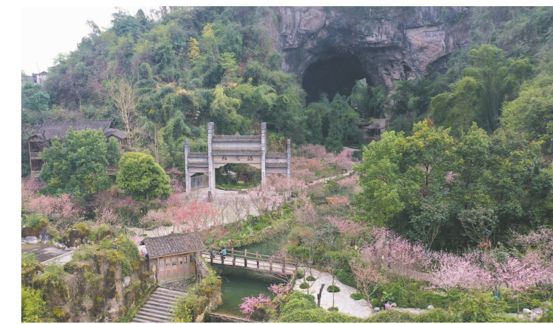
酉阳土家族苗族自治县桃花源。