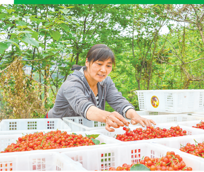
仁寿县吊庆樱桃基地樱桃丰收的同时迎来乡村旅游旺季。