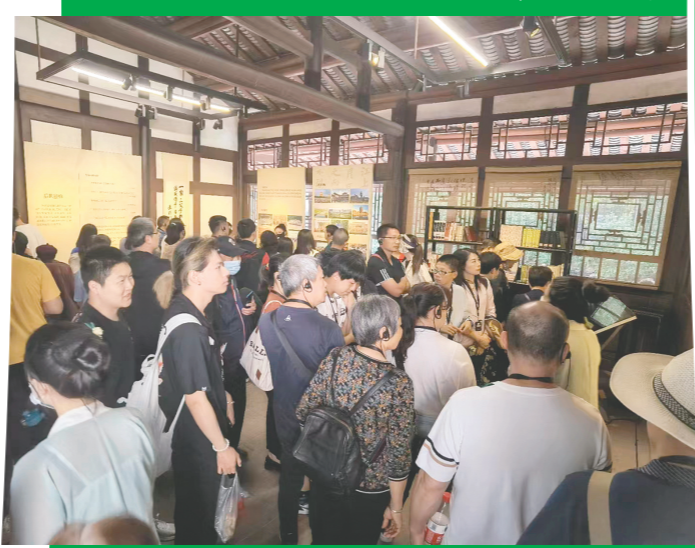
“五一”假期,三苏祠人气爆棚。

数据显示,7场乡村游活动吸引3000余人参与,7次旅行直播吸引35万余人线上观看,宣传了幸福古村、曹家梨花、扯井山桃花、竹里稻香等18个乡村旅游点位。“我们还同时推出了丹棱冻粿、仁寿芝麻糕、风干牛肉、钵钵鸡等16种地方特色美食,洪雅高山茶、藤椒油、果小酒、樱桃、丹棱不知火等30余种当地特产乡村旅游商品。”市文广旅局相关负责人介绍,“以节俭促旅、以旅兴农”,不仅带动了各县(区)乡村旅游景点转型升级,也促进了当地住宿、餐饮、乡村旅游产业蓬勃发展,带动当地农民增收致富,有效激活了乡村振兴发展新动能。