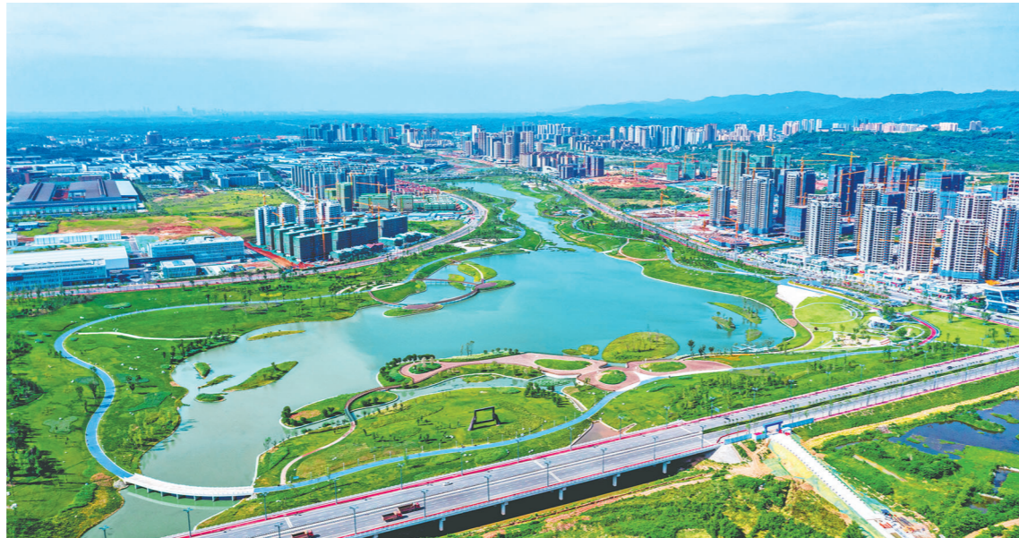
眉山天府新区唱好“双城记”,加速产业集聚,城市能级提升。

该指数以建设现代化都市圈为目标,形成“城镇化+高质量+同城化”三大评价板块,建立发展水平指数、建设进程指数两套评价体系,通过详实数据和丰富案例对成都都市圈做了画像。