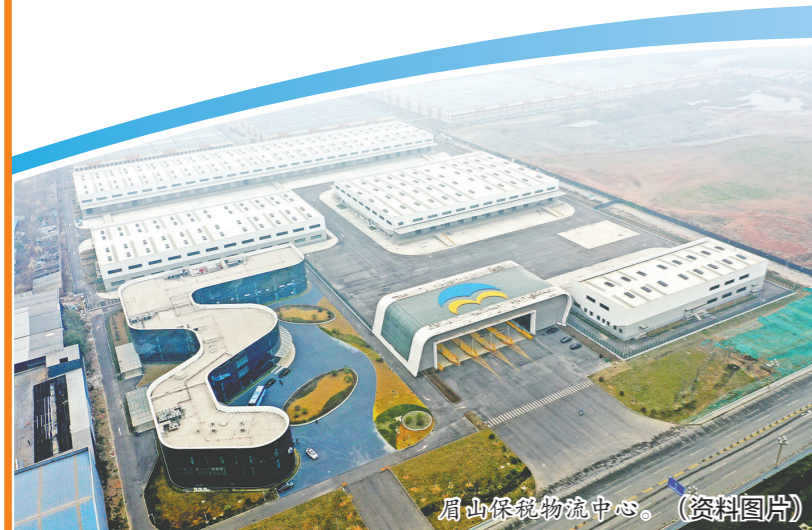
眉山保税物流中心。(资料图片)

对于成都都市圈的发展潜力,上海财经大学长三角与长江经济带发展研究院执行院长张学良认为非常值得期待。成都都市圈发展看成都,区域内成都的龙头地位明显,未来可以继续增强辐射带动作用,以点带线做好走廊经济。