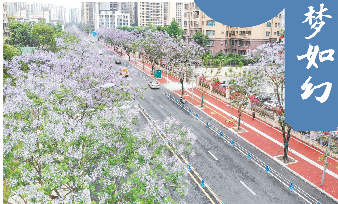
阜成路,蓝花楹开满整条街道。

初夏时间,蓝花楹盛放,一朵朵、一簇簇,随风摇曳,如梦如幻,漫天的紫色“云霞”为眉山的街头巷陌增添了一抹浪漫色彩。就让我们跟随镜头,领略蓝花楹盛放的美丽吧。