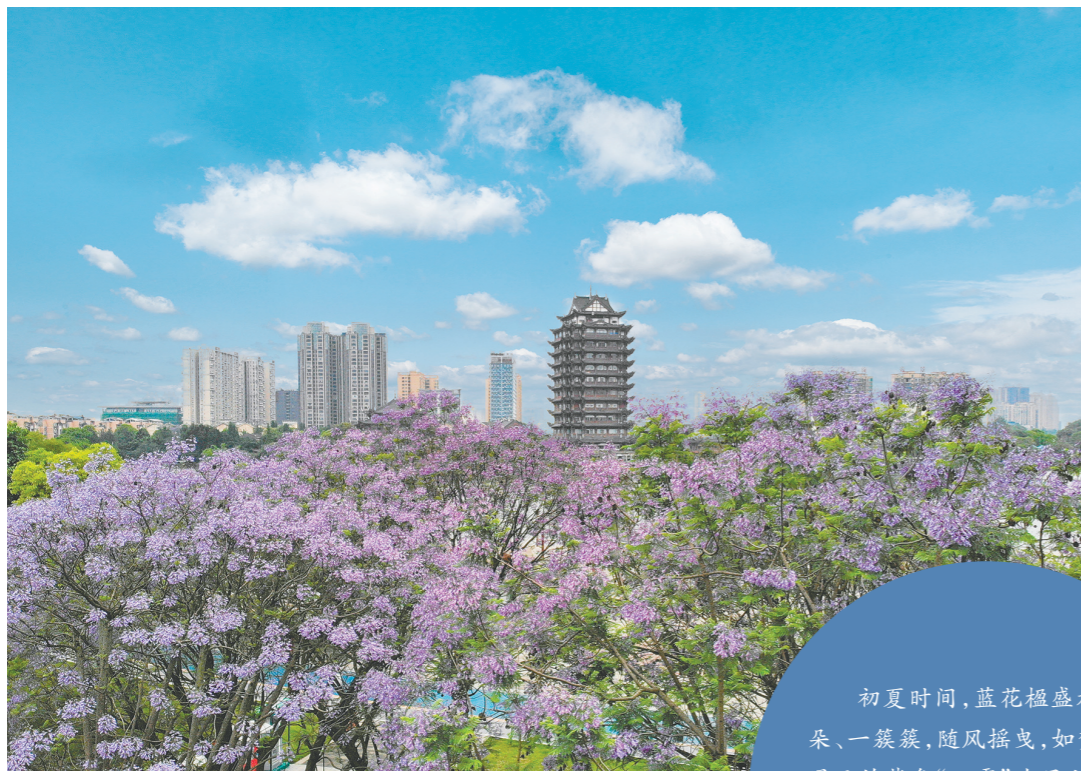
东坡城市湿地,蓝花楹盛放。