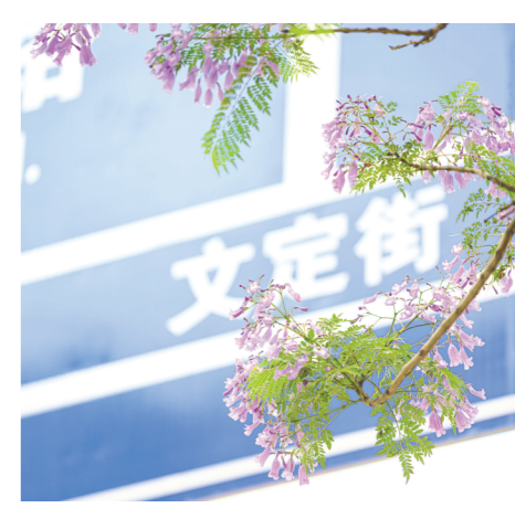
梦幻的紫蓝色。