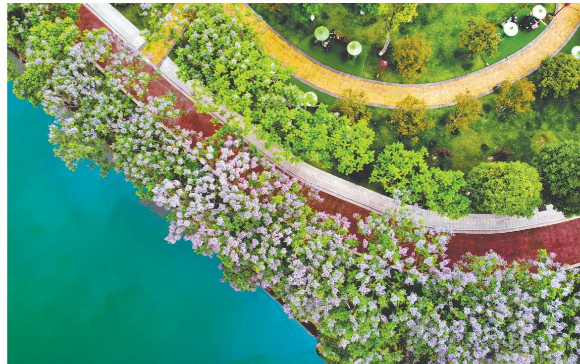
苏母公园,蓝花楹美不胜收。