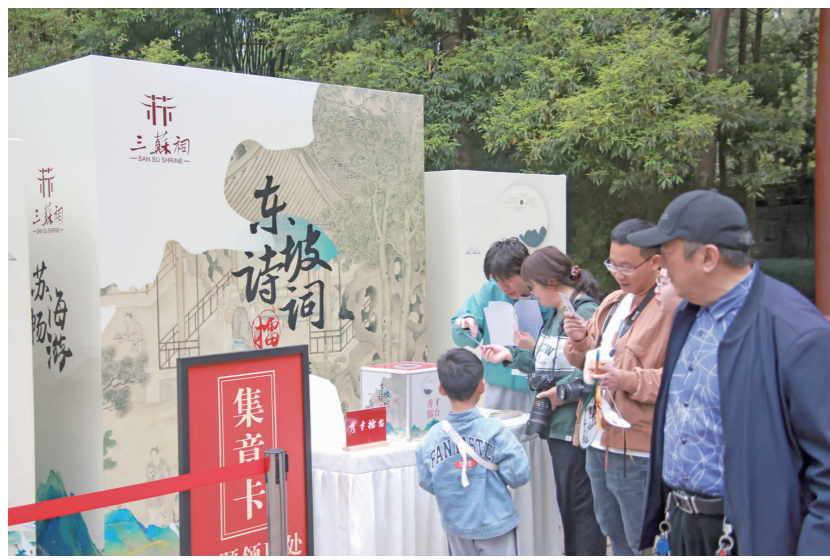
擂台赛吸引不少游客参加。

本报讯(眉山日报全媒体记者 杨鹏 文/图)“苏东坡在《惠州一绝》中写道:‘罗浮山下四时春,卢橘杨梅次第新’。这里的‘卢橘’指什么?”