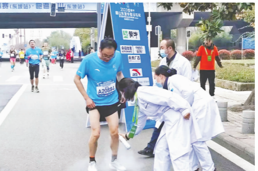
医务人员及时服务。