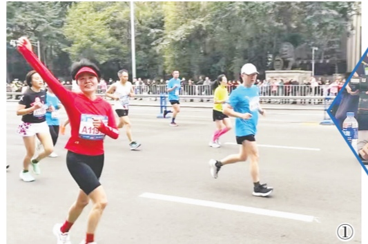
① 医院职工积极参与本次东马赛事，用勇气、毅力以及信心征服了脚下的赛道。