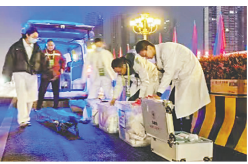
清点急救药品和器械。