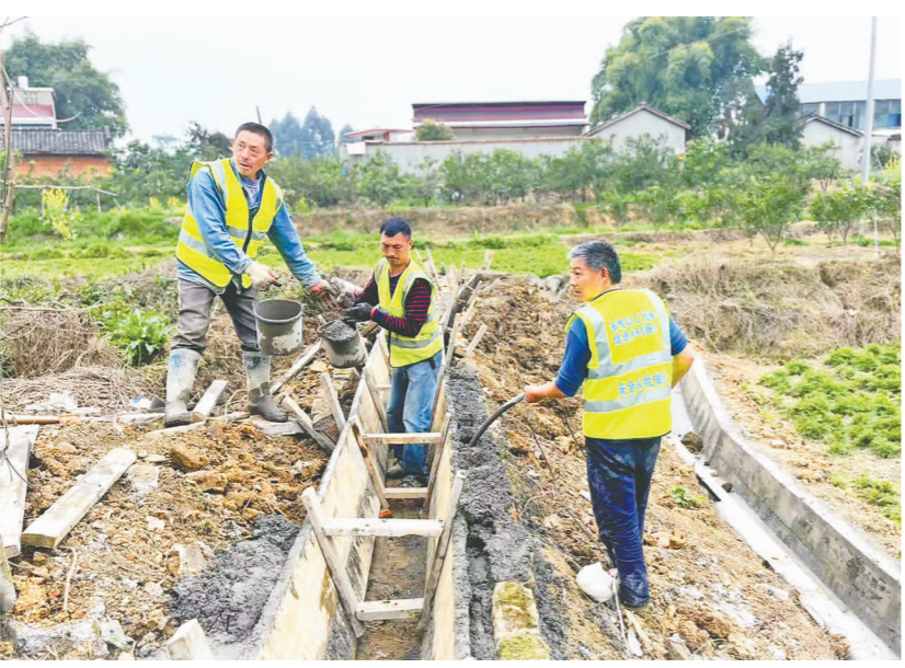
工人们正在修建农田灌溉沟渠。

本报讯(眉山日报全媒体记者王允浩 文/图)近年来，东坡区多悦镇将以工代赈项目建设作为巩固拓展脱贫攻坚成果同乡村振兴有效衔接的重要抓手，通过创新实施“123”工作法，引导群众参与乡村振兴，共享家乡建设成果。