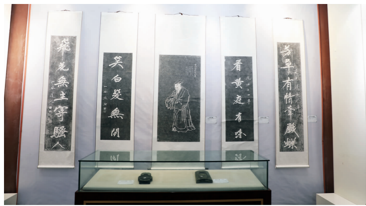
黄庭坚书法作品展示。