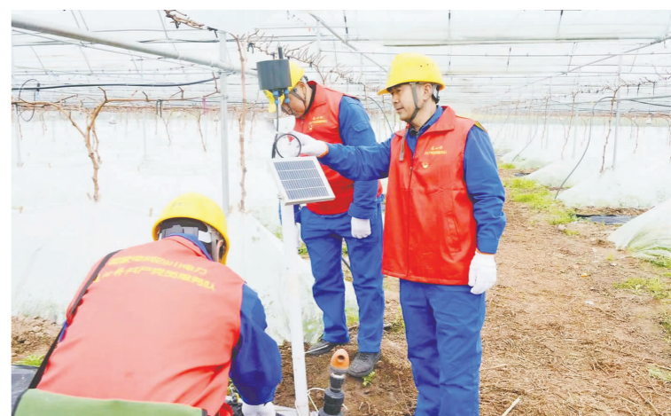
彭山供电公司青龙供电所员工为葡萄种植户检查大棚用电设施。