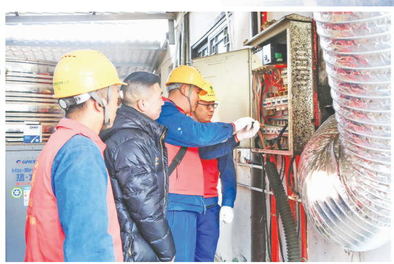
检查安全用电。

季度优秀合理化建议项目进行了表彰,颁发了荣誉证书和奖金。图为眉山方大炭素2022年度先进个人合影。