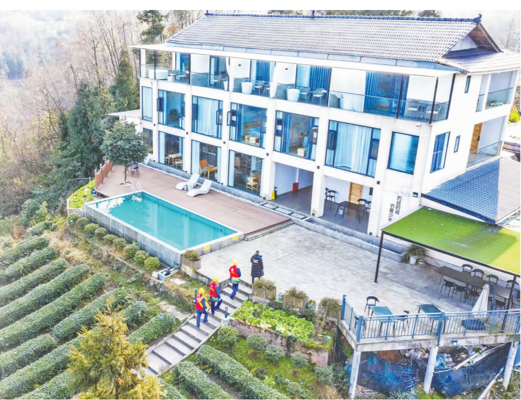
检查人员在“全电民宿”检查安全用电,为即将到来的春季采茶旅游小高峰提供电力保障。