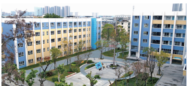
青神县学道街小学校舍改扩建项目。

青神县学道街小学校舍改扩建项目于2022年9月建成投入使用。该项目总投资1500万元,主要对原青神中学校进行改造,包含教学楼功能改造和相关教学设施设备增添等。项目建设完成后,青神县学道街小学校占地面积将由原来的20亩增至59亩,新增标准教室30间、功能室10间,新增学位600个。