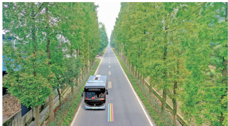
城乡公交一体化正式启动。

2022年5月20日上午,“青神县城乡公交一体化启动仪式暨宇通客车微循环E6S纯电动公交投放”仪式举行,上午十点半,30辆崭新的公交车正式从青神客运中心发出。