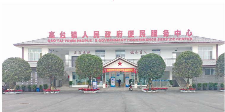
改造后的镇村便民服务中心(站)。

2022年,青神县通过镇村便民服务中心标准化、规范化、便利化(简称“三化”)建设,优化资源配置,增