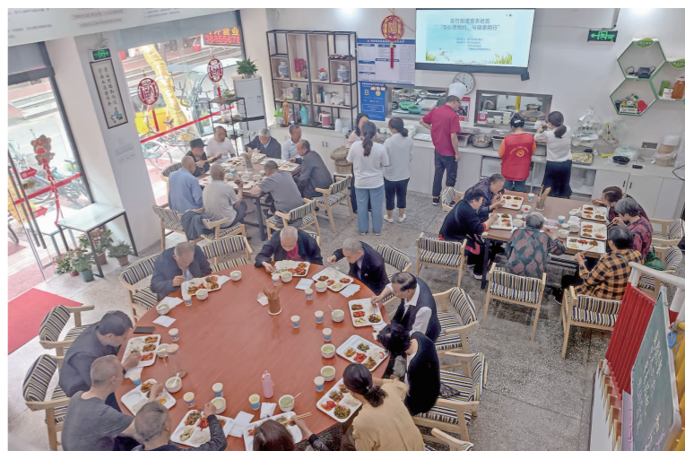
关心关爱特殊群体。