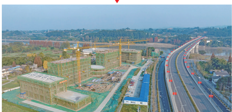
养老服务中心项目建设进展顺利。

挥别2022,这一年,青神县初心不渝,全力以赴答好民生答卷,高位推进民生实事项目落地见效: