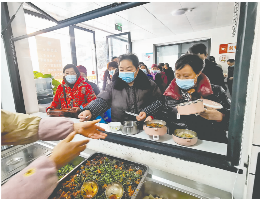
正在就餐的老人们。