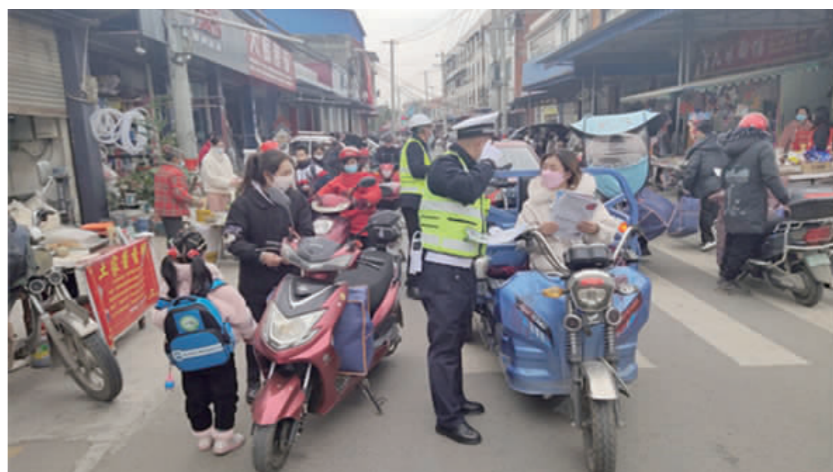
向群众宣讲交通安全知识。

本报讯(王安银 廖文凯 文/图)12月7日，市公安局交警支队直属一大队民警走进辖区东坡区尚义镇开展“美丽乡村行”交通安全巡回宣讲活动，旨在加强冬季农村地区交通安全宣传工作，有效预防道路交通事故发生。