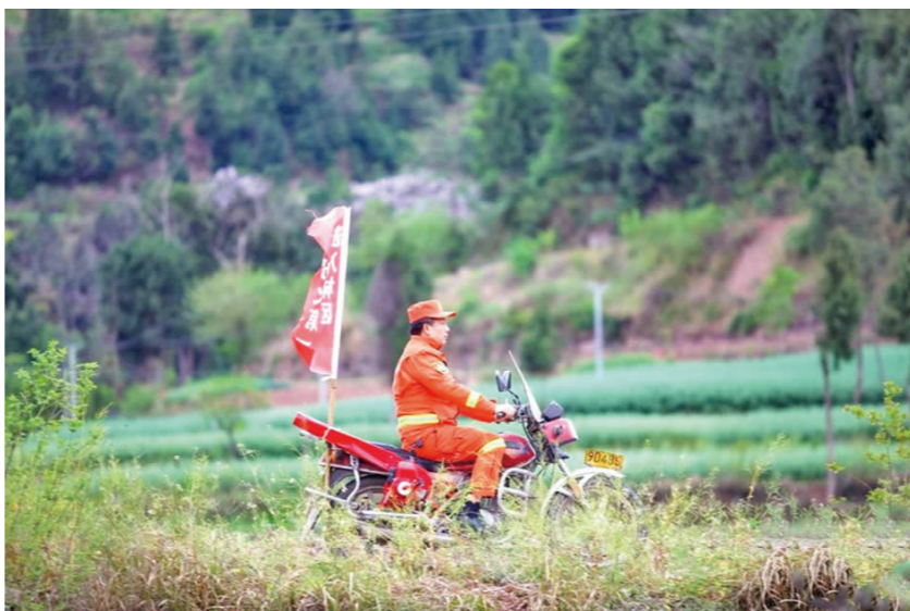
专职护林员在林区开展车巡。