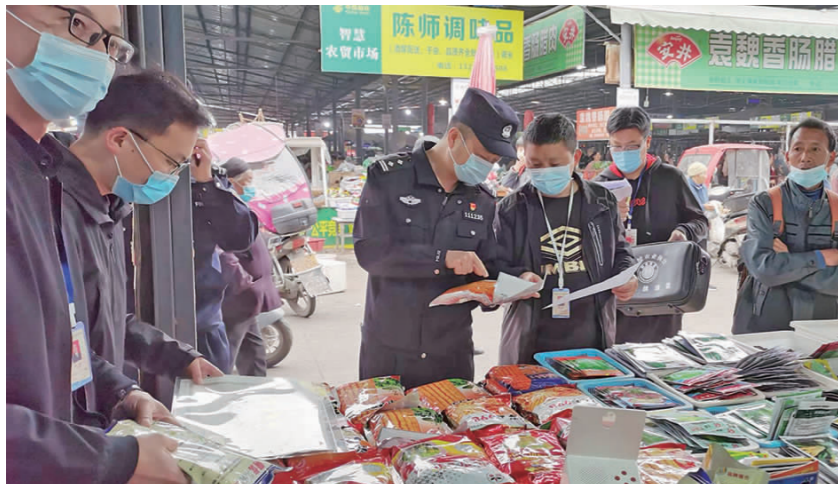
开展农资打假行动。