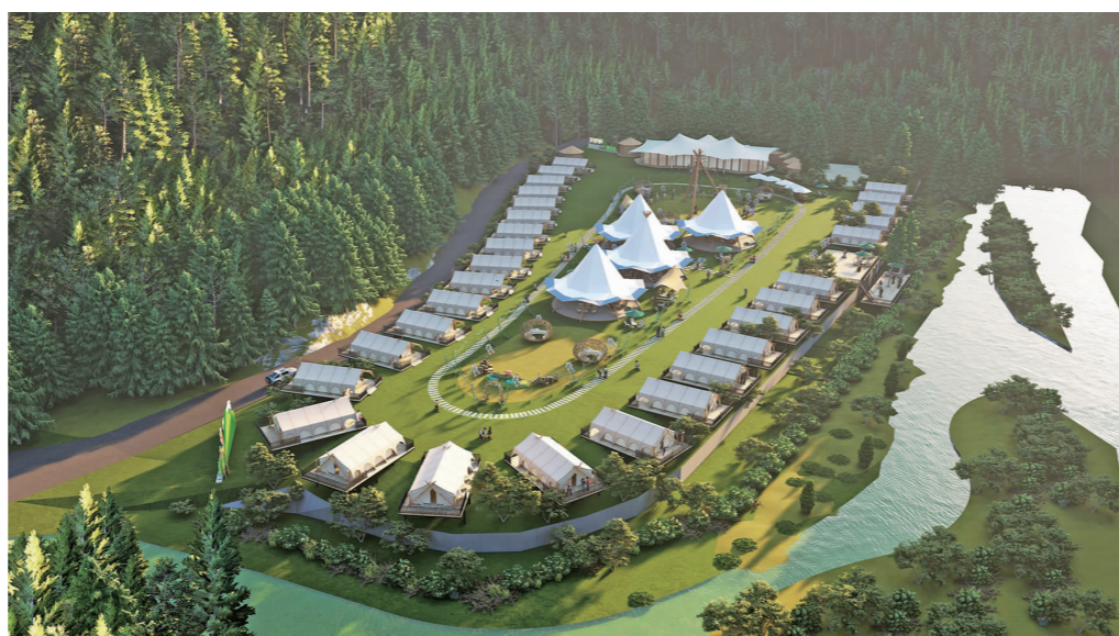
大寺河熊猫森呼吸帐篷营地。

近年来,洪雅县全力做好雪文章、做强雪经济,不断推进瓦屋山旅游基础设施建设,综合利用瓦屋山冰雪资源和文旅资源富集优势,打造丰富多彩的冰雪节系列活动和冰雪旅游线路。景区还在食宿行上狠下功夫,提档升级、推陈出新,发挥旅游协会职能,对旅游从业人员进行培训指导。同时,该县旅游服务志愿者将定期在景区为游客提供暖心服务。