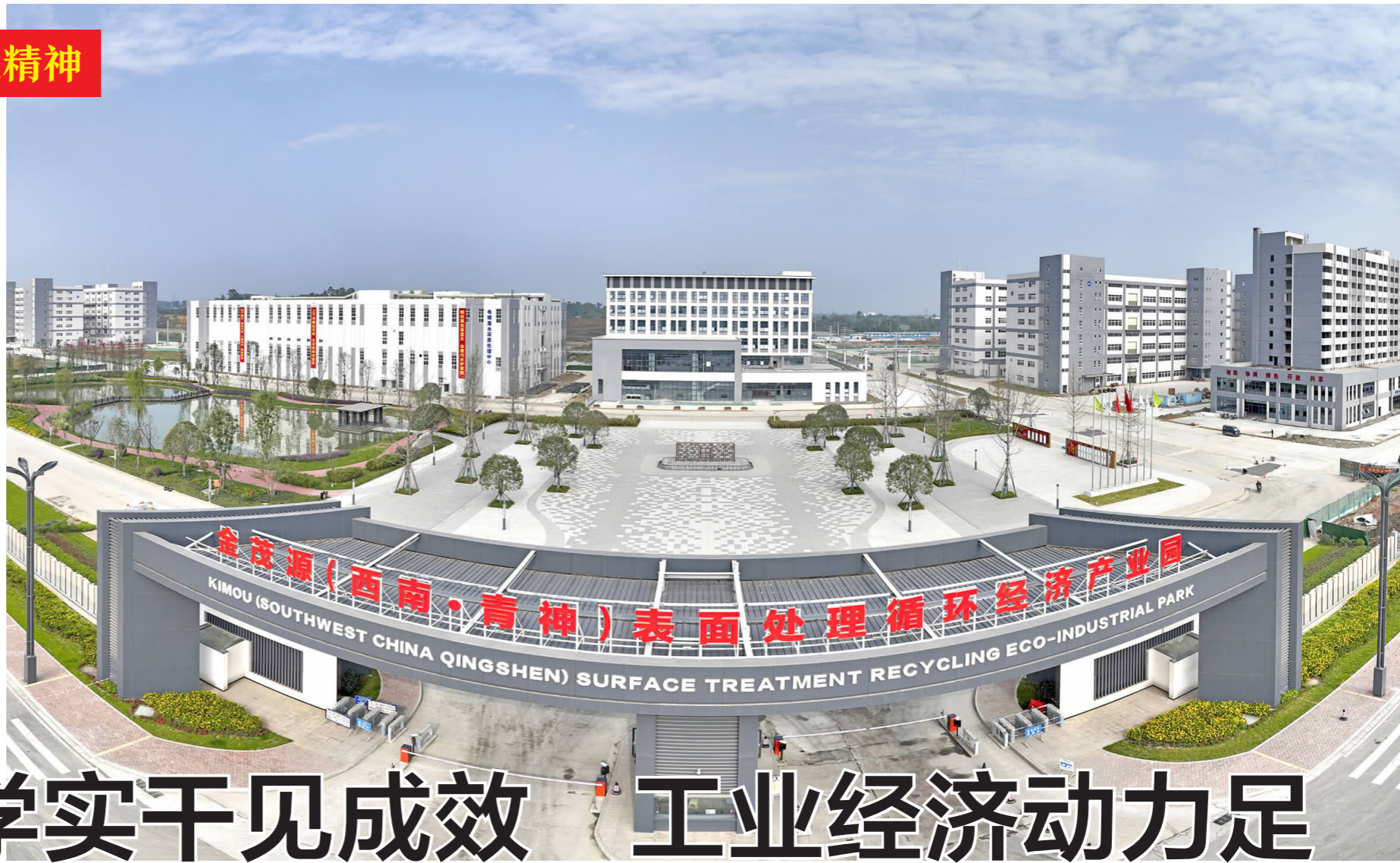
西南表面处理循环经济产业园楼宇林立、水景漂亮、绿化优美,工业上楼助推高质量发展。