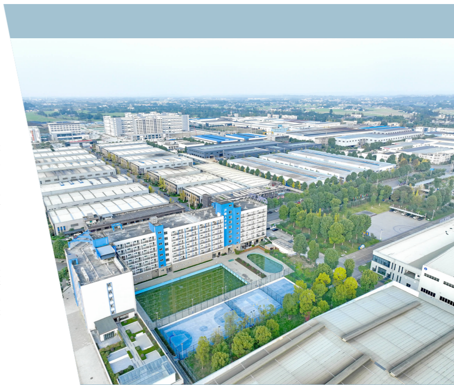
工业园区蓬勃发展

“开发区扩区让我们消除了后顾之忧,希望我们的项目能早日建成投产。项目入驻以来,青神良好的营商环境与服务给我们留下深刻印象,此次扩区成功,更让我们信心倍增。我们觉得当初选择青神是非常正确的。”在西南表面处理循环经济产业园,一位企业负责人说。