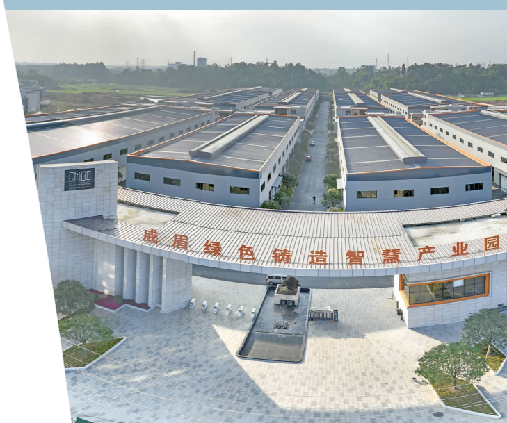
成眉绿色铸造智慧产业园项目。

“青神紧盯机械产业全链构建和数字赋能,积极探索机械产业为主导,专业园区成链条,数字转型为动力,绿色低碳强根本的四大发展路径。目前,机械产业已初步形成‘铸造锻造+粗精加工+表面处理+整机生产’全产业链条,‘先进制造业+服务业’产业发展格局。”青神县相关负责人表示,下一步,该县将进一步聚焦做强机械产业,发挥产业聚集优势,招大引强、培优育壮,努力打造全国“专精特新”装备制造基地和全国特色先进机械制造产业聚集区。