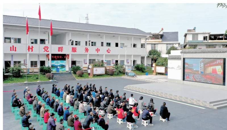
10月16日,在洪雅县洪川镇祝山村,县纪委监委机关干部和村党员群众一起收看党的二十大开幕式直播。