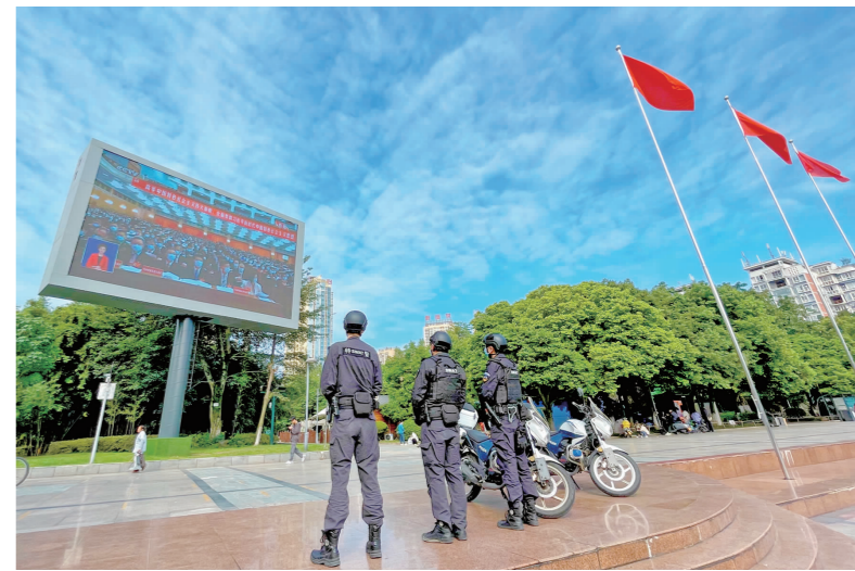
洪雅公安特巡警收看党的二十大开幕式直播。