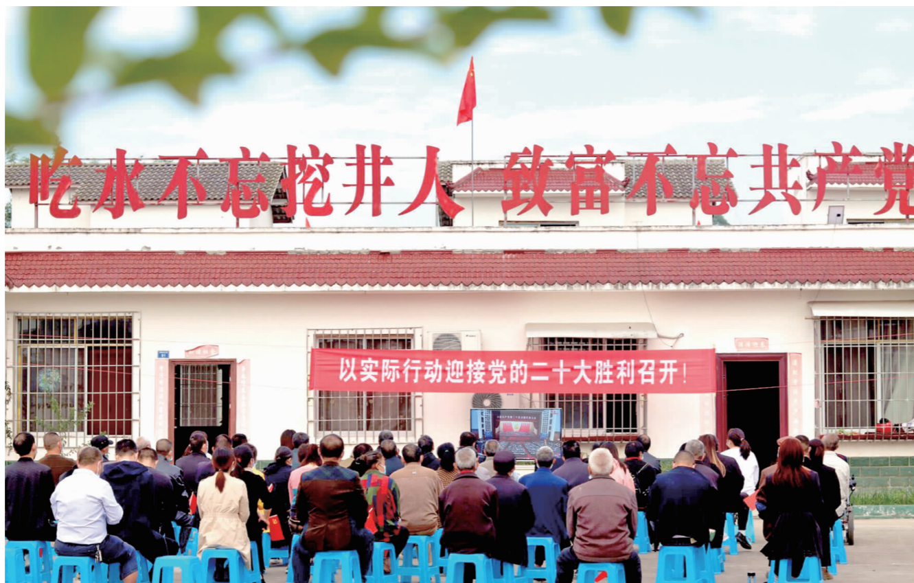
仁寿县怀仁街道黑虎社区党员干部群众在易地搬迁聚居点,收看党的二十大开幕式直播。