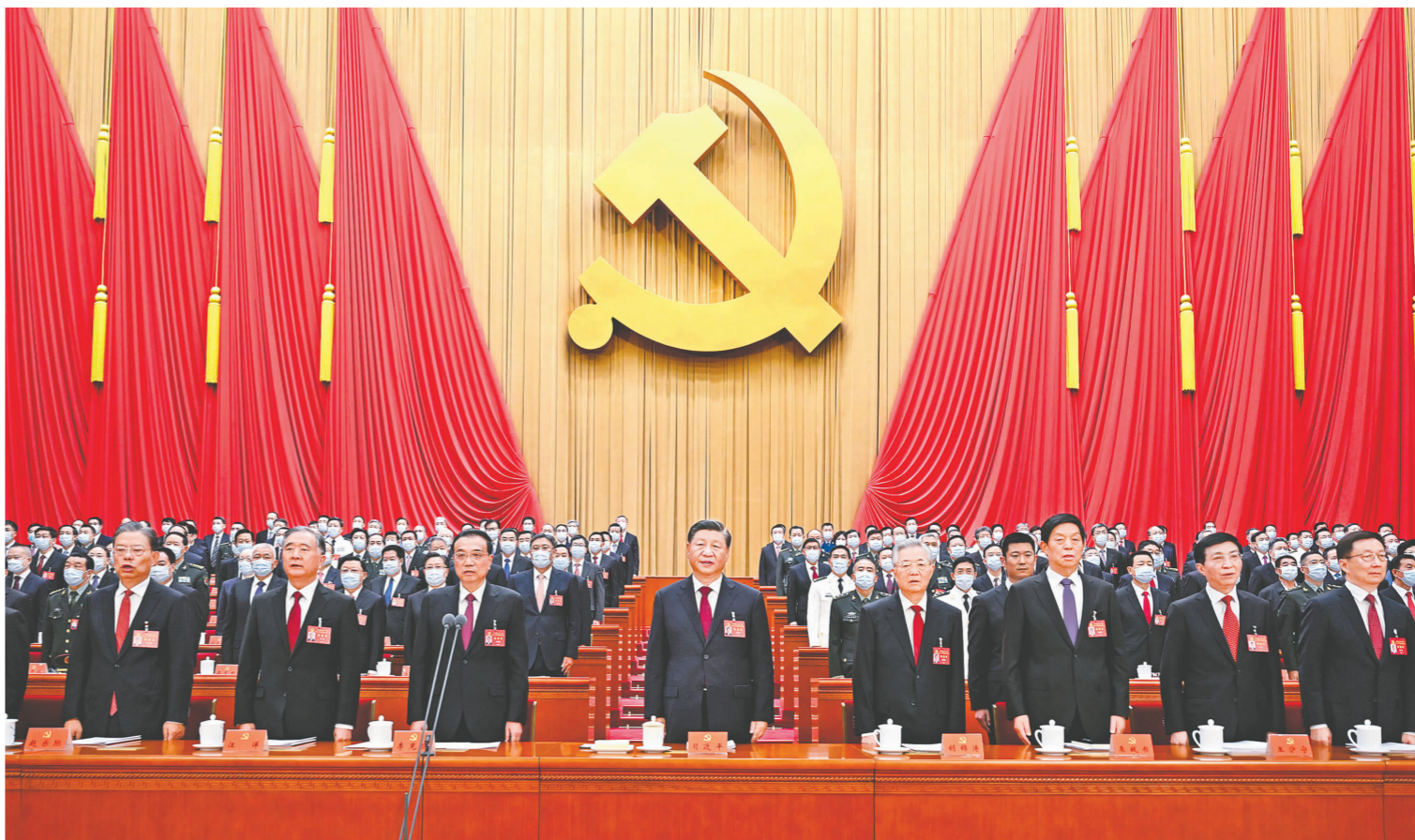
10月16日,中国共产党第二十次全国代表大会在北京人民大会堂开幕。这是习近平、李克强、栗战书、汪洋、王沪宁、赵乐际、韩正、胡锦涛在主席台上。

新华社北京10月16日电 凝心聚力擘画复兴新蓝图,团结奋进创造历史新伟业。举世瞩目的中国共产党第二十次全国代表大会16日上午在人民大会堂开幕。