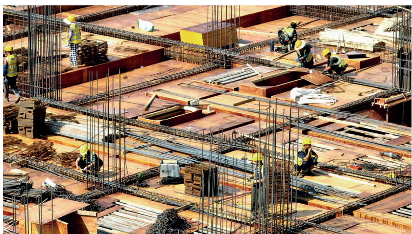
眉山天府新区中医医院建设现场。