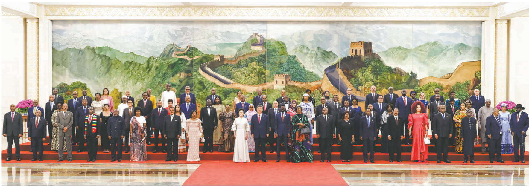
9月4日晚,国家主席习近平和夫人彭丽媛在北京人民大会堂举行宴会,欢迎来华出席中非合作论坛北京峰会的非方及国际贵宾。这是宴会前,习近平和彭丽媛同贵宾们集体合影留念。