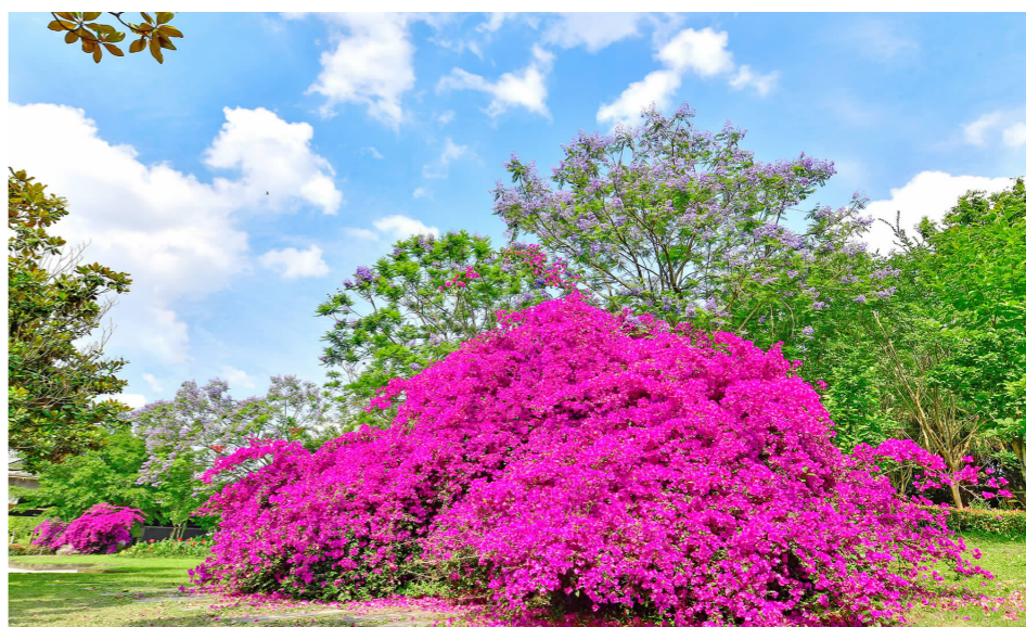
湖滨路的三角梅,花开正艳。