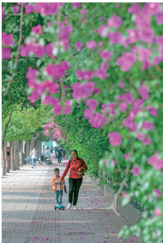
文定街道路旁的三角梅形成了一条美丽的鲜花走廊。