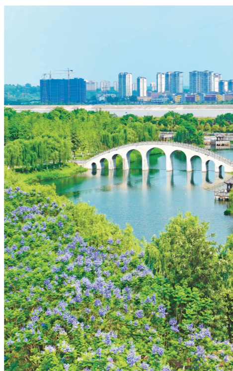
苏辙公园的蓝花楹走廊成为市民的热门“打卡点”。