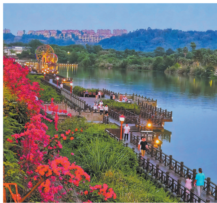
漫步在三角梅盛开的东坡湖步行栈道,让人心旷神怡。