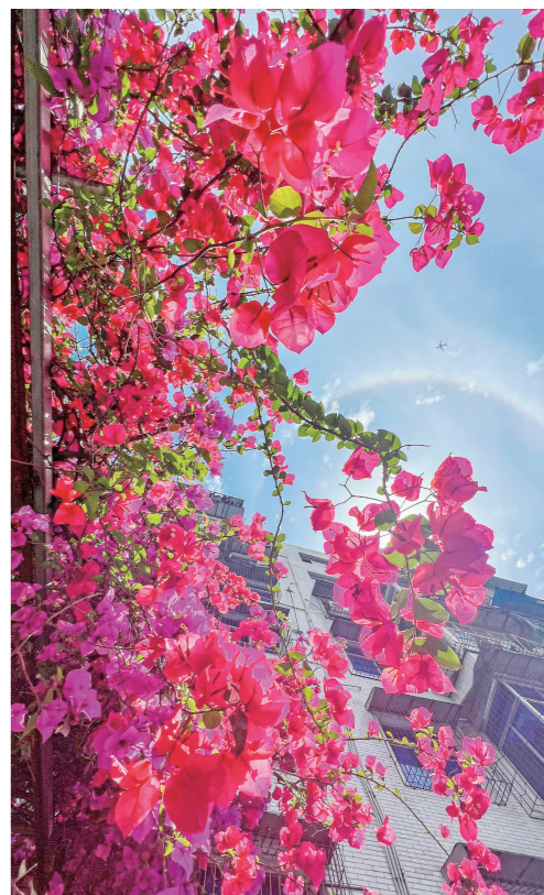
阳光下,红艳艳的三角梅覆盖了小区的楼房。