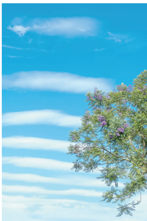
借我云梯来观东坡城市湿地蓝花楹。