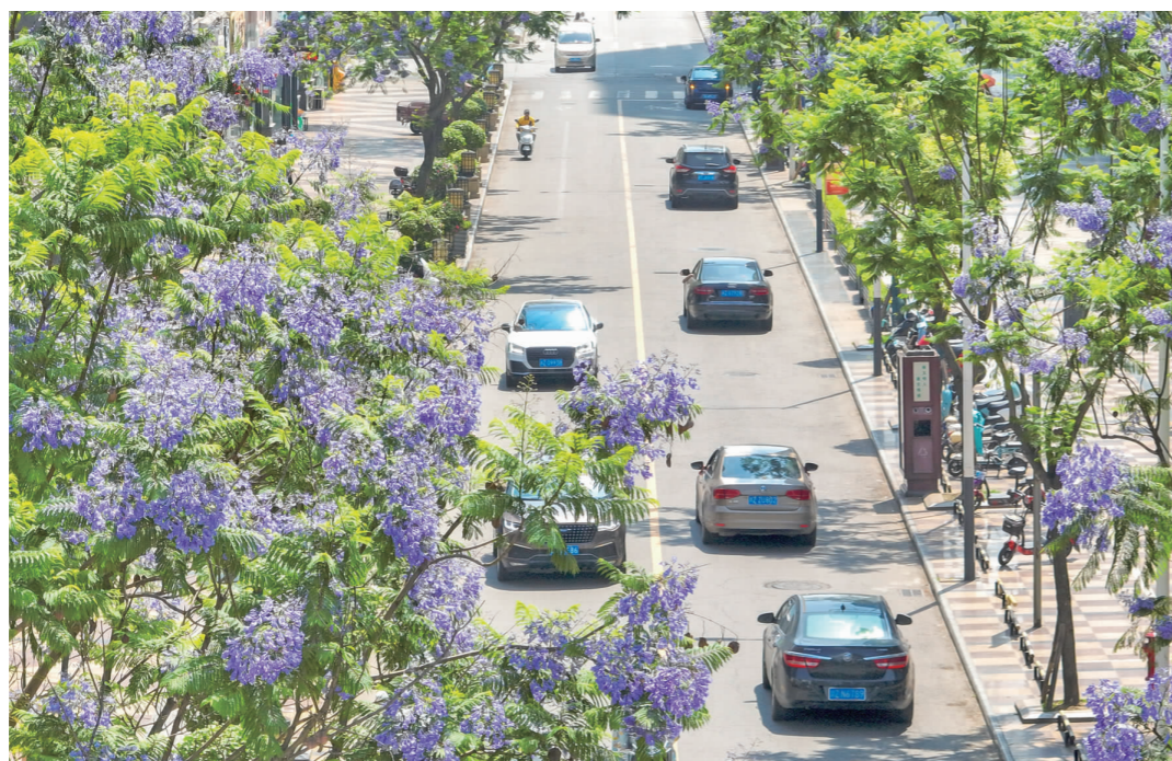
车行于蓝花楹盛开的道路,心情格外愉悦。