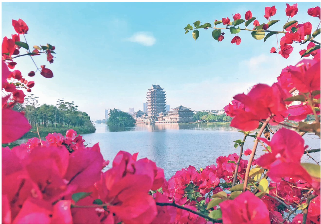
醉月桥头花团锦簇,浓密的三角梅构成一幅美丽图画。