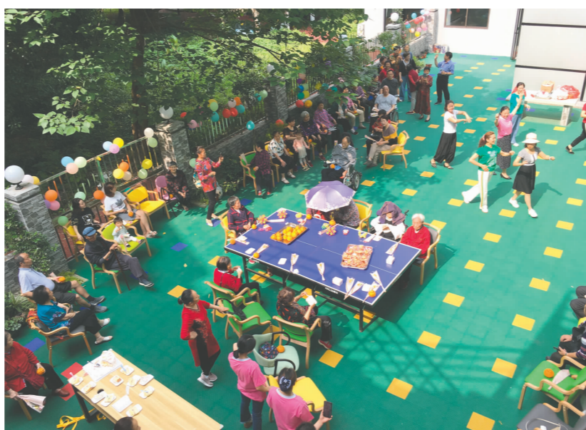
养老服务中心让老年人安度晚年。

据介绍,近年来,我市先行先试、大胆创新,全力推进养老服务体系建设。2019年,在农村养老工作中探索出“四个三”农村养老服务经验模式,在全国大城市养老服务工作会议暨全国养老服务推进视频会议上作经验交流。2020年,我市在城市养老工作中探索出“综合体+”城市普惠养老服务模式,在全国第四批居家和社区养老服务改革试点中期验收评估中获评优秀等次,并被民政部、财政部优中选优予以嘉奖。如今,“15分钟”普惠养老服务网络已在市逐渐形成。