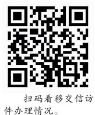
扫码看移交信访件办理情况。

中央第五生态环境保护督察组转办我市第十批信访举报件共计4件(其中来电2件、来信2件)。截至9月14日,已办结4件。