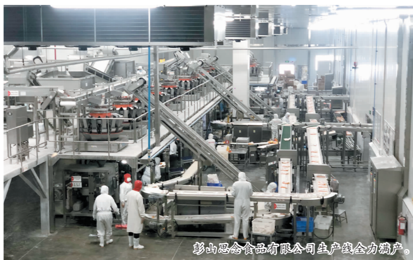
眉山思念食品有限公司生产线全力满产。

市政务服务中心通过互联网端、手机APP、微信公众号、免费邮寄或电话等方式进行相关业务咨询、预