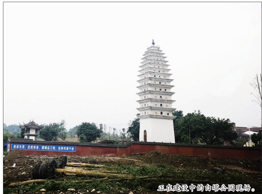
正在建设中的白塔公园现场。

本报讯(记者 王琴 文/图)11月20日，在丹棱镇白塔社区白塔公园建设现场，堆坡造型、绿化栽植、地面铺砖、景观打造……工人们各司其职，一项项工作正有序推进。