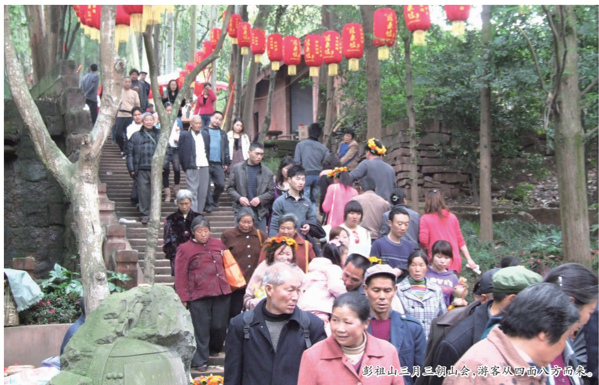
彭祖山三月三朝山会，游客从四面八方而来。