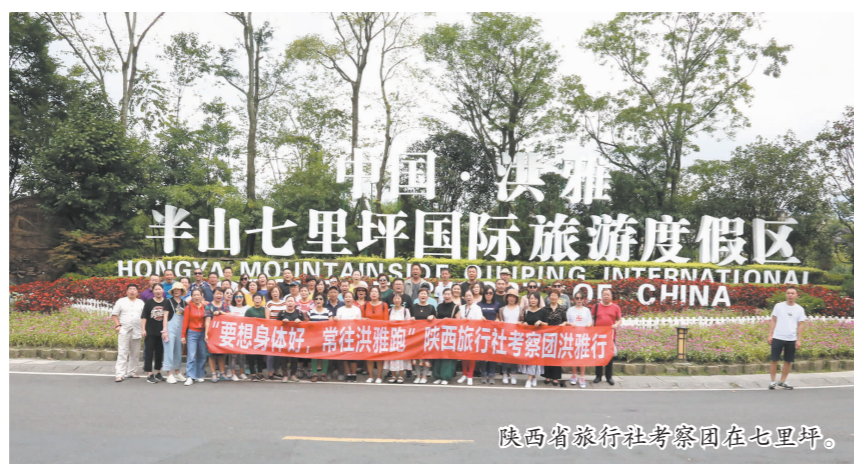
陕西省旅行社考察团在七里坪。

“这两天在洪雅的行程,让我们看到这里的山清水秀、淳朴民风。在传统观光旅游逐渐呈下滑趋势的当下,洪雅县大力发展康养度假旅游,