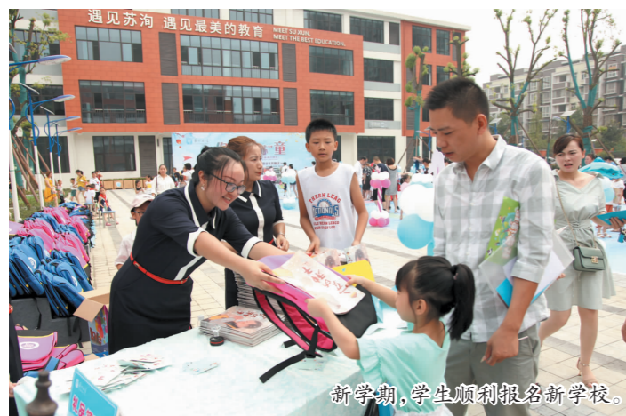
新学期,学生顺利报名新学校。