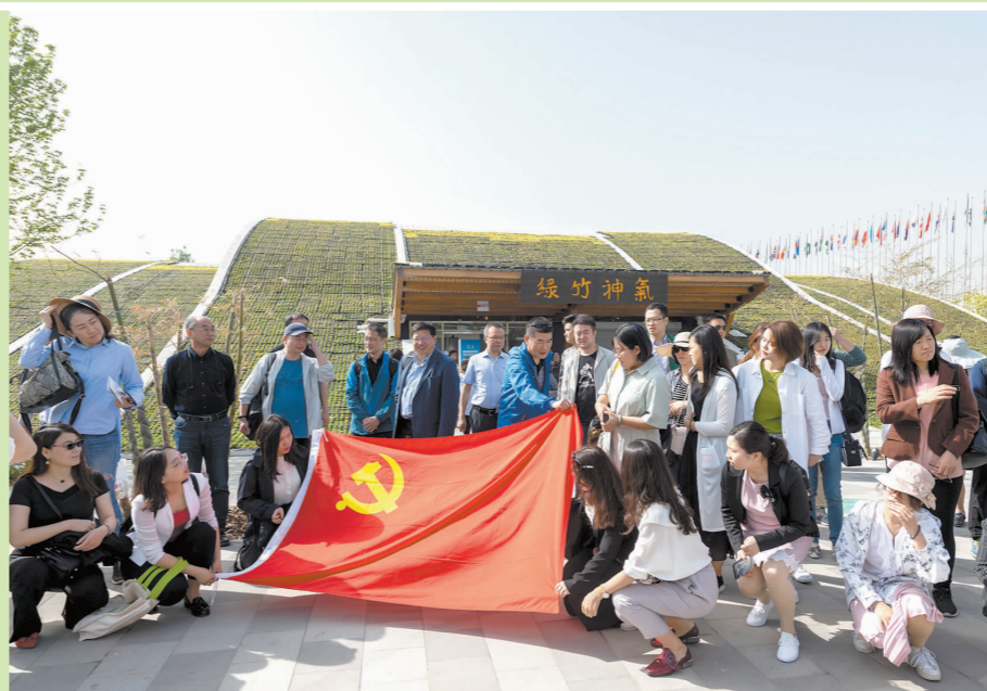
游客们在国际竹藤组织园外合影。