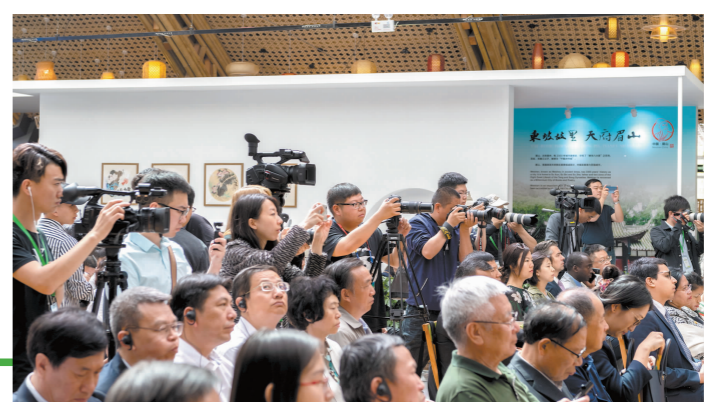
媒体采访国际竹藤荣誉日活动。