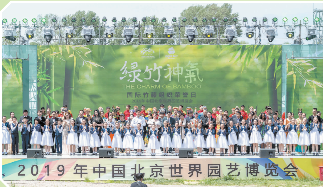
“绿竹神气”主题文艺演出取得圆满成功。