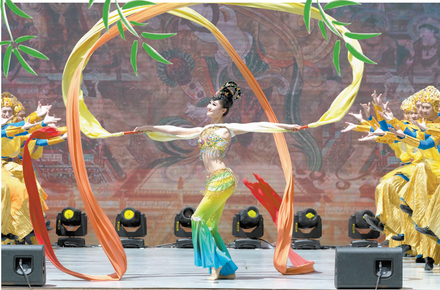
“绿竹神气”主题文艺演出中,眉山市文化馆表演的《丝路花雨》。