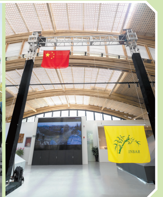
国际竹藤组织大厅中依次升起了中国国旗和国际竹藤组织旗。