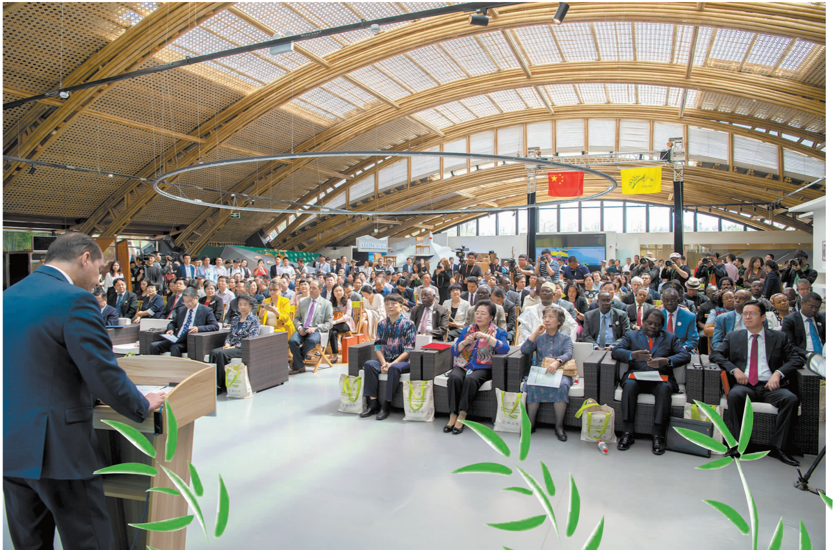
国际竹藤荣誉日活动现场。