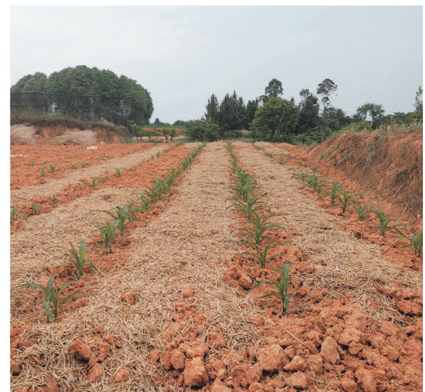
▶机械化收割后的秸秆还田。