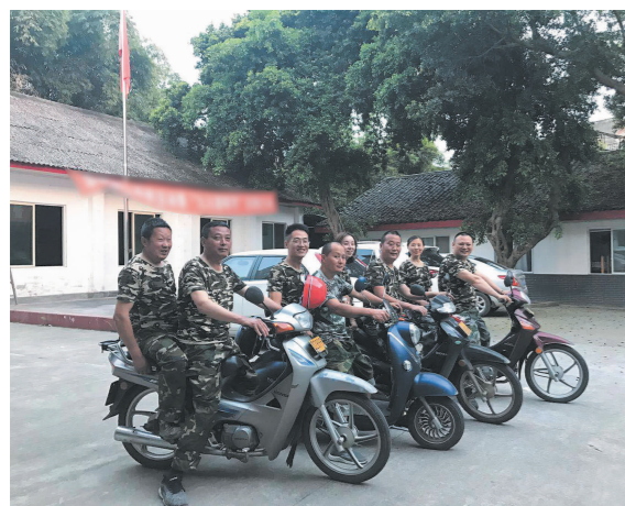
因地制宜使用摩托车、电瓶车等交通工具进行秸秆禁烧集中宣传。

通过流动宣传车、悬挂宣传横幅、张贴宣传标语、宣传栏、广播、动员会、坝坝会等形式,青神县广泛宣传焚烧秸秆的危害和秸秆禁烧的意义,以及相关的法律法规。如今在全县农村,群众已形成了“不敢烧、不能烧、不想烧”的意识。