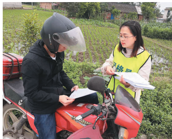
网格员走村入户,向村民发放秸秆禁烧倡议书、通告。

谈起下一步的工作打算,青神县相关负责人表示,将继续调整种植业结构,将种植油菜调整为种植蔬菜、水果、莲藕等农作物,减少秸秆产生量;继续推进秸秆肥料化利用,大力推广秸秆机械化粉碎还田、秸秆覆盖腐熟还田还园技术,建立水稻、玉米、油菜秸秆机械化粉碎还田示范区;继续推进秸秆饲料化利用,扶持规模化养殖企业、农民专业合作组织、养殖大户等建设青贮氨化场地,推广秸秆青贮、氨化等饲料化利用技术;继续推进秸秆能源化利用,围绕改善农村居民生活燃料结构和燃烧习惯,推广节能燃具;继续推进秸秆基料化利用,在食用菌生产区域,鼓励食用菌种植户开展秸秆食用菌基料化利用。