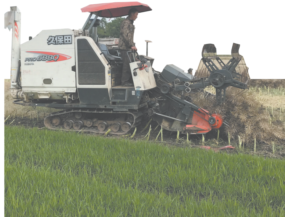
▲今年全县3万亩油菜实现机械化收割,为秸秆禁烧提供了技术保障。

截至目前,全县共张贴、发放秸秆禁烧通告80000余份,发放倡议书60000余份,悬挂宣传横幅400余幅,出动宣传车60余辆。如今,通过深入广泛的宣传发动,秸秆禁烧成了全县干部群众的自觉行动。