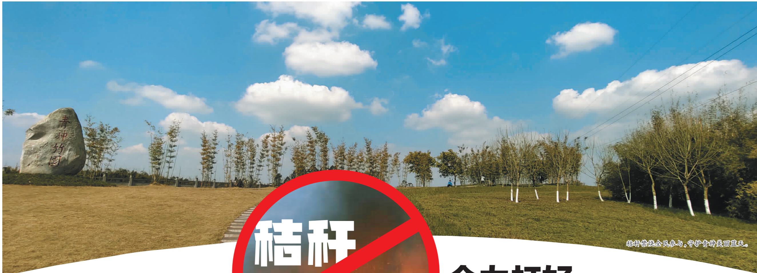
秸秆禁烧全民参与,守护青神美丽蓝天。