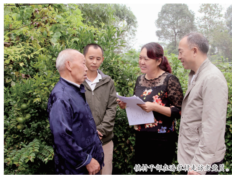
镇村干部在彰加镇走访老党员。

为加强基层党组织建设和社会治理，切实提高为民服务意识，解决庸懒散浮拖问题，进一步改进干部作风，连日来，仁寿县彰加镇组织116名镇村干部集中开展“走基层、解难题、办实事、惠民生”为主要内容的“户户访”活动。