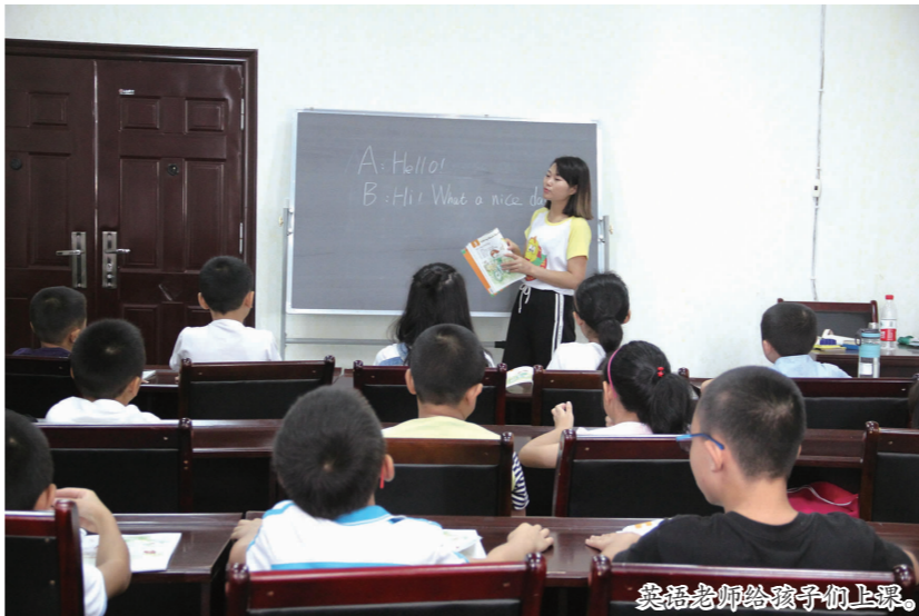
英语老师给孩子们上课。