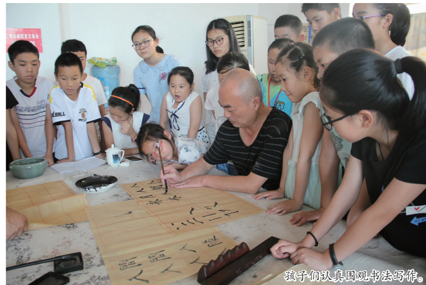
孩子们认真围观书法写作。