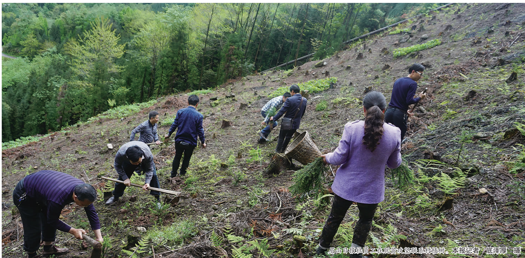
眉山日报社员工在观音女寨联系贫困村。