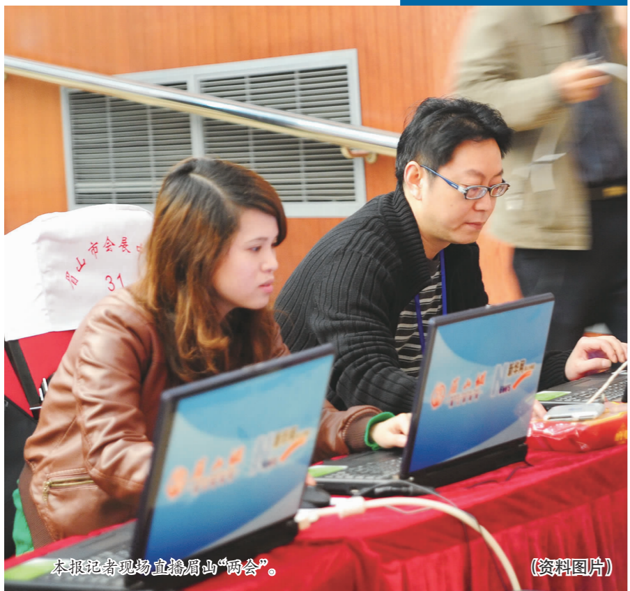
本报记者现场直播眉山“两会”。