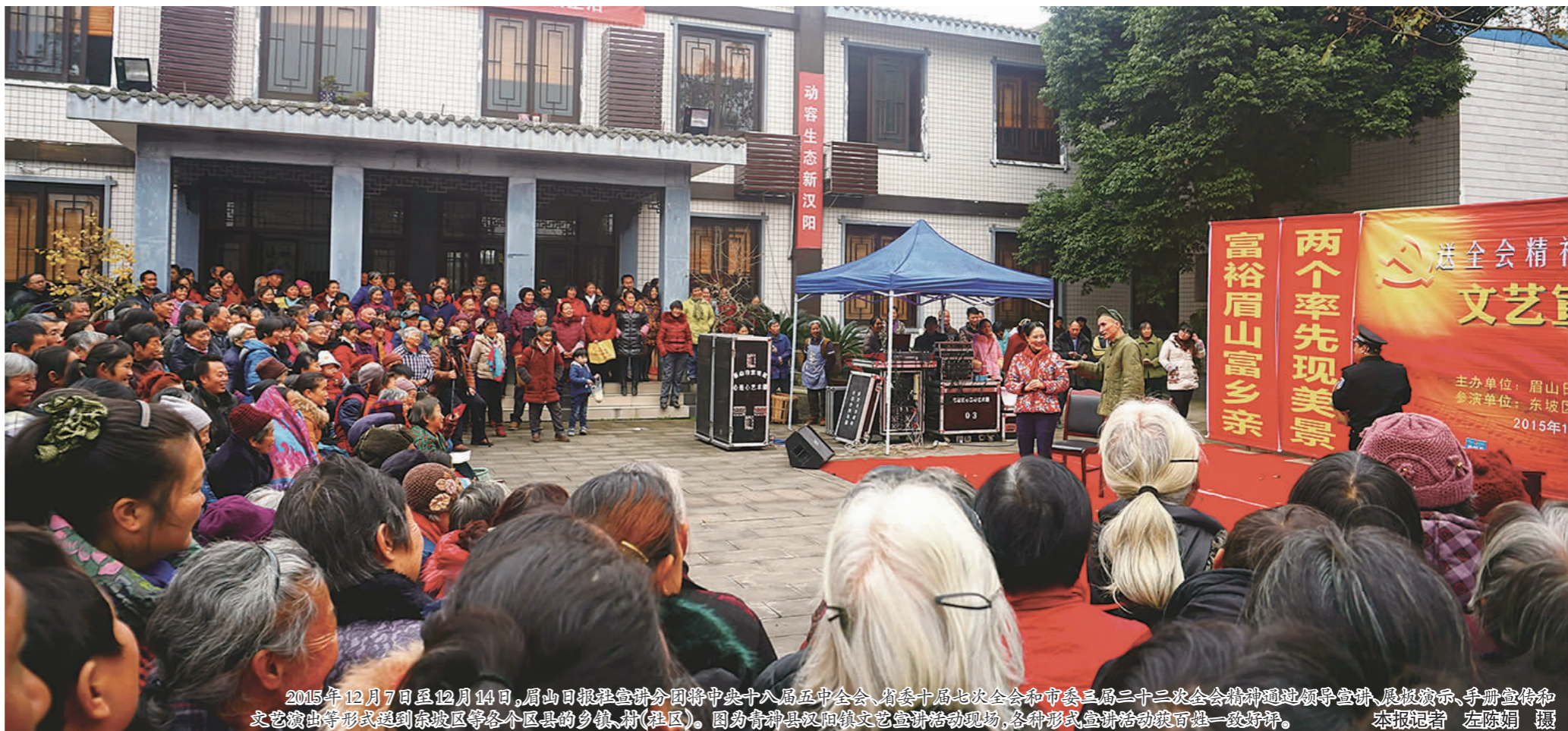
2015年12月7日至12月14日，眉山日报社组织分团将中央十八届五中全会、省委十届七次全会和市委三届三十二次全会精神通过领导宣讲、展报新闻、手册宣传和艺术演出等形式送到东坡区等各个区县的乡镇、村(社区)。图为青神县双阳镇文艺宣讲活动现场，各种形式宣讲活动深受百姓一致好评。

20年来，我们深入基层，贴近群众，关注和记录眉山的发展变化，用手中的相机和纸笔作出一篇篇鲜活的报道。 20年来，我们牢记使命与担当，用肩上的责任和胸中的道义坚守，做好社会的瞭望者。