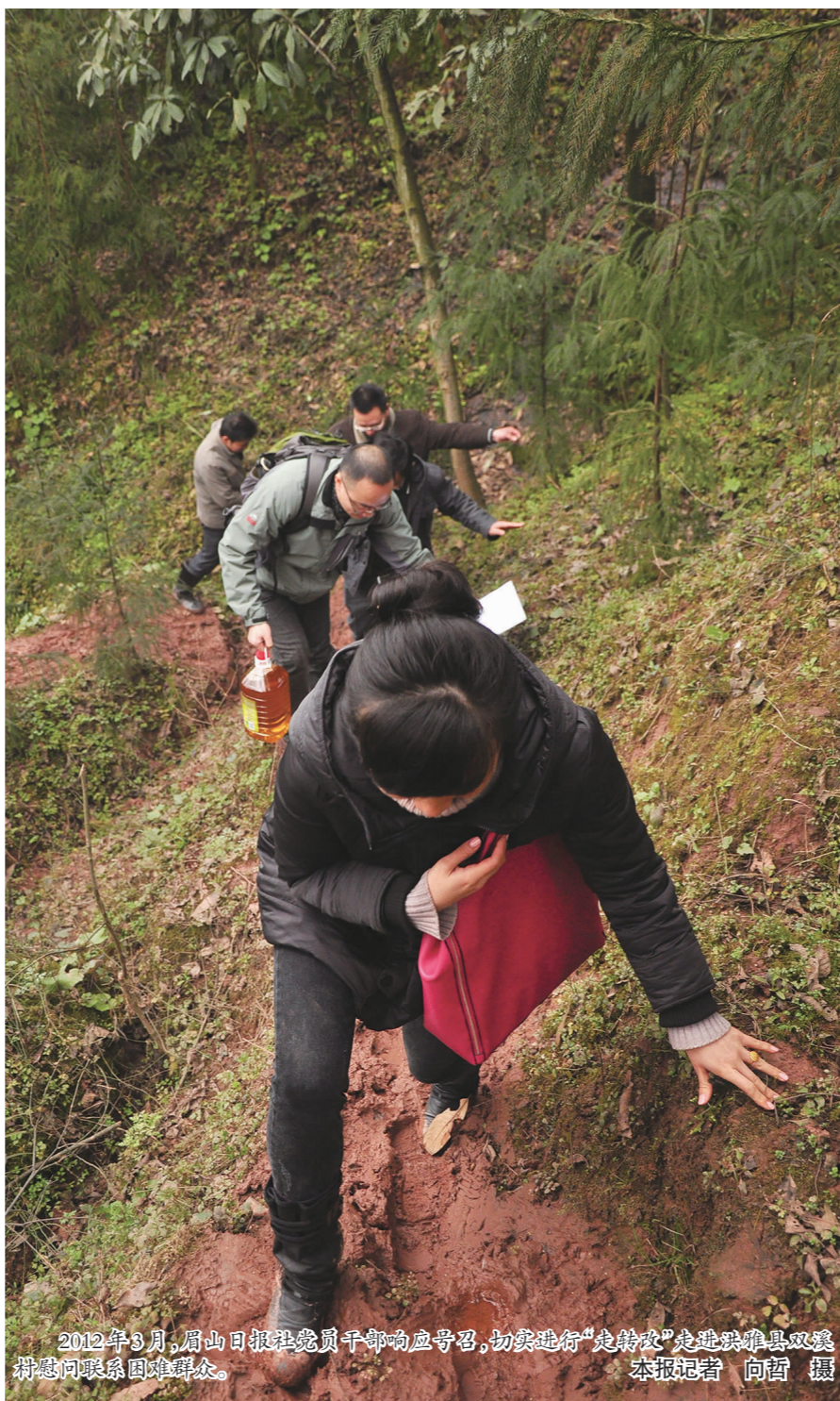
2012年3月，眉山日报社党员干部响应号召，切实进行“走转改”走进洪雅县双溪村慰问联系困难群众。

20年来，我们深入基层，贴近群众，关注和记录眉山的发展变化，用手中的相机和纸笔作出一篇篇鲜活的报道。 20年来，我们牢记使命与担当，用肩上的责任和胸中的道义坚守，做好社会的瞭望者。