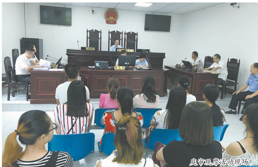
庭审观摩活动现场。

对庭审观摩活动的了解与认识。随后,汪洋法庭负责人与社区干部、群众代表进行了座谈,并认真听取了与会人员的建议和意见,对提出的问题一一进行了解答。观摩人员纷纷表示,合议庭法官在主持整个庭审过程中思路清晰,归纳焦点准确,展示了良好的法律素养和庭审驾驭能力。通过此次观摩庭审,也进一步增强了大家的程序意识、证据意识和法律意识。