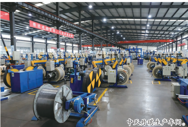
中天丹琪生产车间。