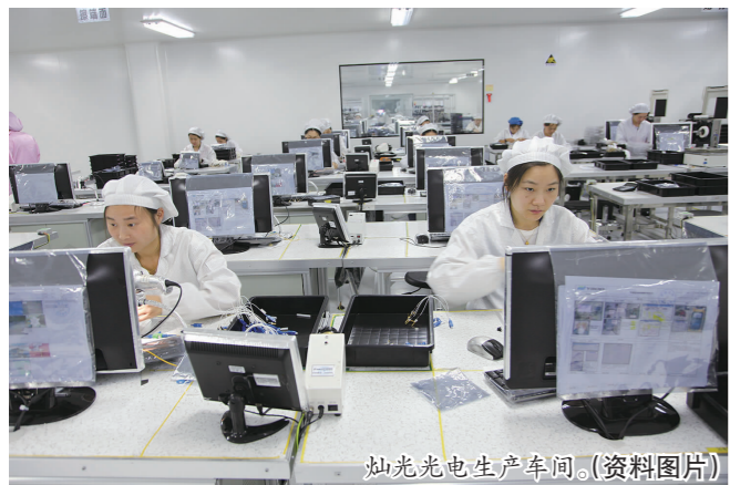
灿光光电生产车间。(资料图片)