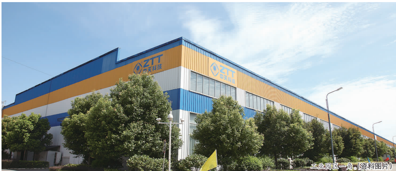
工业园区一角。