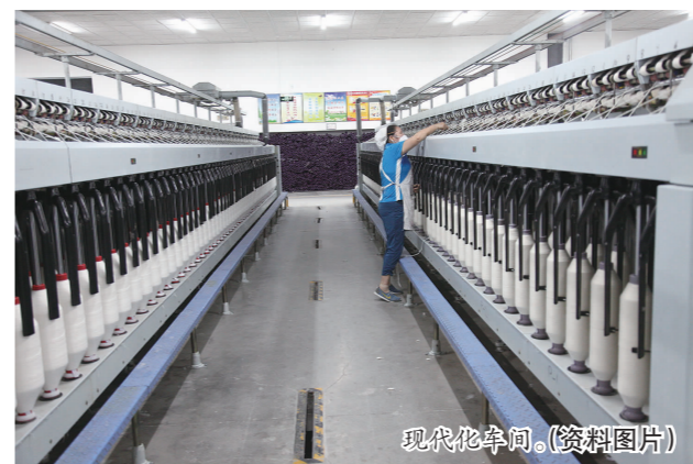
现代化车间。(资料图片)

服务创新激发发展活力。仁寿县委、县政府高度重视工业经济的发展,全县上下形成了重视工业、关心工业、齐心协力发展工业的良好局面。每年出台工业发展意见,在招商引资、产业升级、要素保障、深化改革、经济稳增长、推进新型工业化、人才引进等方面的一系列规划及政策性文件,为促进工业经济健康发展提供了坚强的政策保障。创新推行“审批先行、资料后补”项目审批服务机制,审批时限由180天缩短为61天。2011年以来,向省上上报工业争取资金项目144余个,充分发挥财政资金“四两拨千斤”的作用,撬动民间工业投资达30余亿元,为推进产业转型升级、企业创新发展起到了显著推动作用。加快推进水、电、气、路、通讯等工业发展配套设施建设,为加快推进新型工业化建设提供坚强的要素保障。