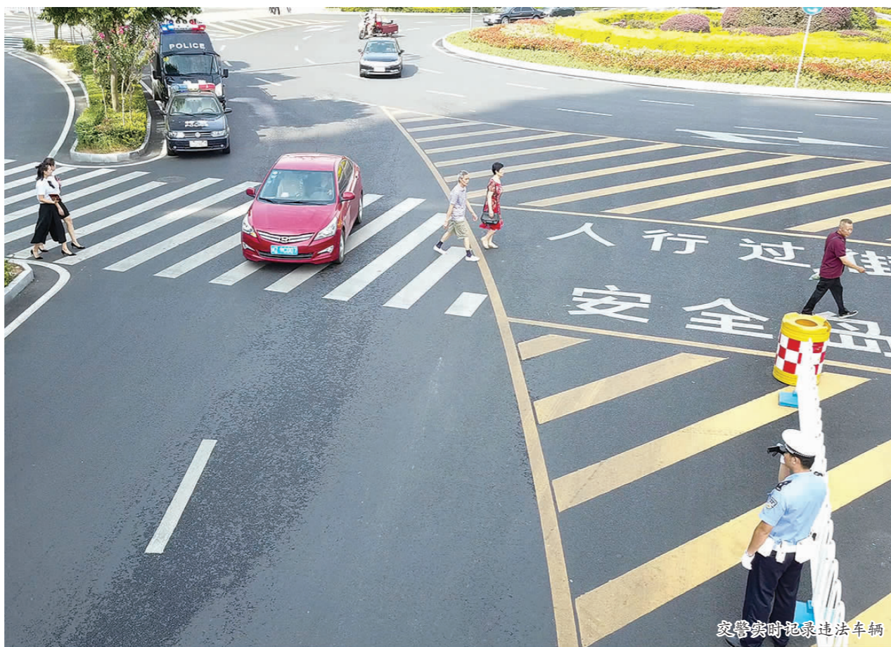
交警实时记录违法车辆。

近日上午,市公安局交警支队直属二大队在眉山市城区宏远盖丽广场附近,查处行人正在通过人行横道未停车让行的机动车,并在现场进行交通安全教育。