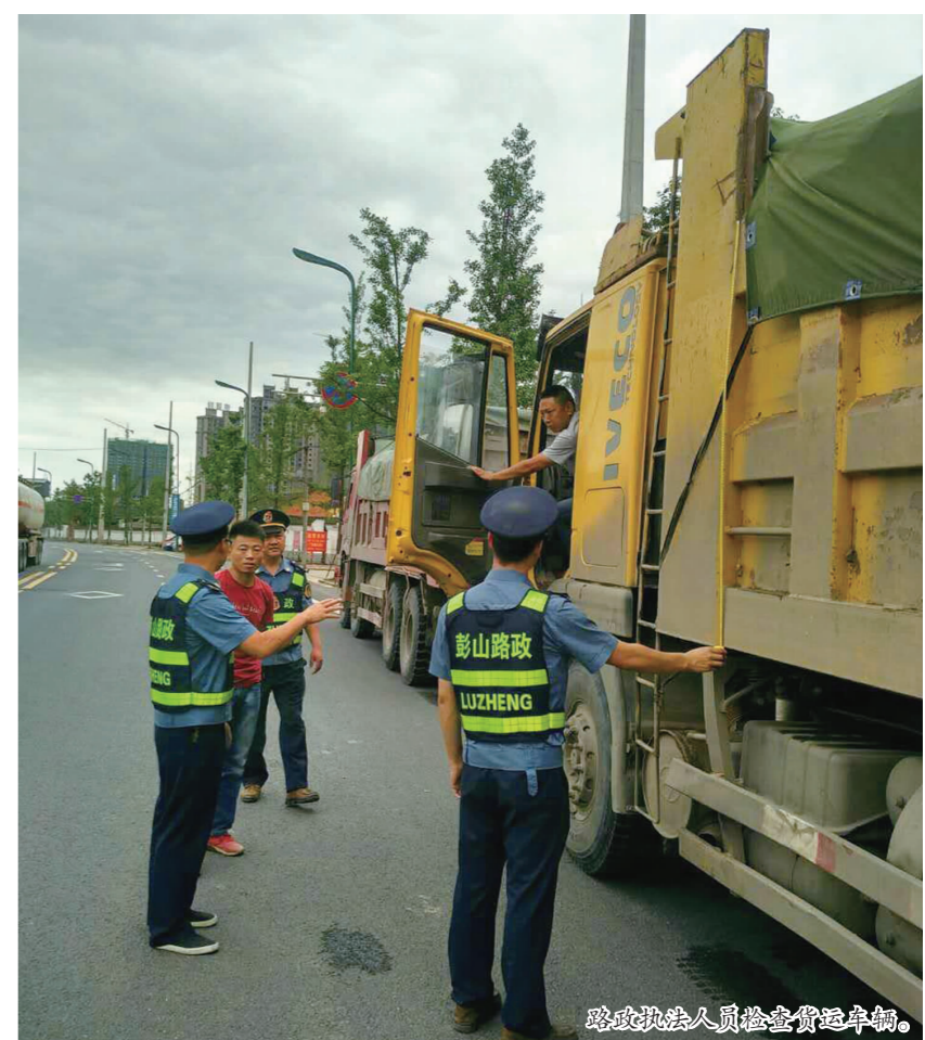
路政执法人员检查货运车辆。

本报讯(孟成兵 记者 廖文凯 文/图)发放宣传资料,接待法律咨询,严查抛洒滴漏……今年以来,彭山区路政大队加强对超限超载、抛洒滴漏车辆的查处力度,消除公路安全隐患,减少公路扬尘对大气的污染,环境治理取得成效。