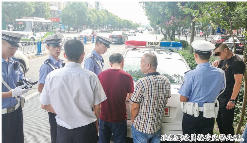
违规驾驶员接受交警处理。