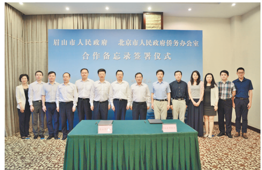
眉山市人民政府与北京市人民政府侨务办公室签署合作备忘录。